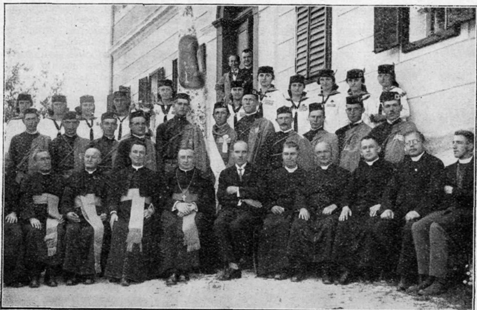
Orlovska družina Sv. Križ pri Rogiški Slatini ob priiki blagoslovitve društvenega doma.

Naša sveta dolžnost bodi, da neustrašeno delamo v našem krožku, ne meneč se za kritiko nasprotnikov. Spoštujmo svoj materin eezik, ne sramujmo se svojega mišljenja, pokazimo se v pravi luči kot zveste hčere slovenske matere. Pokazimo, da slovensko dekle