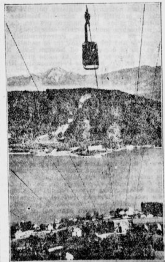
Osojsko jezero z vzpenjačo Kanzelbahn in hotelom Annenheim. V ozadju Jeka.

— Motnje v želodu in črevesu, šepanje v trebuhu, zastajanje v žilnem sistemu, razburjenost, nervoznost, omotičnost, hude sanje, splošno slabost olajšamo, če popijemo vsak dan čašo »Franz Josefovec« grenčice.