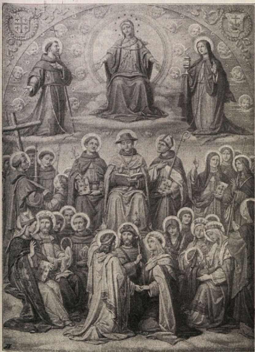
Najlepsi cvetovi iz serafinskega vrta.