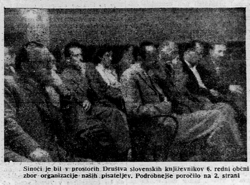
Sinoči je bil v prostorih Društva slovenskih književnikov 6. redni občni zbor organizacije naših pisateljev. Podrobneje poročilo na 2. strani

Na Kozari v Bosanski krajini, ki je bila takrat že vsa osvobojena, se je pred 8 leti začela velika tretja sovražna ofenziva. Ta ofenziva se je s poznejšo peto sovražno ofenzivo vpisala med največje in najbolj častno prestane preizkušnje naših oboroženih sil med osvobodilnim bojem. Nemci in ustaši so bili skraj v dvajsetkratni premoči proti našim borcem, ki jih je bilo tedaj na Kozari nekaj nad 3400.