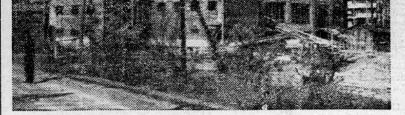
Nova menza v študentskem naselju je že pod streho

lišču na Tošinem bunarju) je zrastle novo delavsko naselje — nad 100 malih stanovanjskih hišic in velikih stanovanjskih blokov. Okrog 10.000 delavcev je že našlo v njih udobna stanovanja. Po novem naselju so že razpredeni zeleni drevedni in parki. Zgrajeni je tudi Dom kulture. V novih stanovanjskih zgradbah, ki so grajene zelo raznoliko, so notranji prostori kar najbolj racionalno izkoriščeni. V njih so enosobna, dvosobna in trisobna stanovanja. (To si lahko vzamejo za zgled naši arhitekti in gradbena podjetja, ki gradijo vse naše stanovanjske