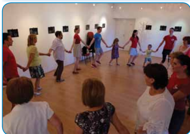
V folklorni delavnici so se stari pa mladi navčili par slovenski plesov

rejši. V Varaši so se nutpokazali petkrat: od nji smo vidli sloven-