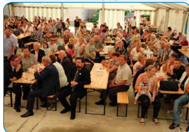
Šator so napunili Slovenci iz porabski vasnic, Varaša, Sombotela pa Pešte