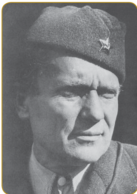
Josip Broz Tito je biu sin rovačkoga očö pa slovenske matere, po bojni pa skoro 40 lejt pelo Jugoslavijo

kulturo ino gezik. Po prvoj svetovnoj bojni je v Italiji že živelo 300 gezero Slovincov - v drügoj bojni pa so toj sausedi prikapčili eške 330 gezero lüdi, 800 gezero Slovincov je prišlo pod nemški rajh, 100 gezero (Prekmurcov) pa nazaj na Vogrsko.