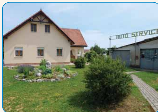
Človek na koj volo ma, tisto dela, če časa nejma, te si ga vzemes tran 8