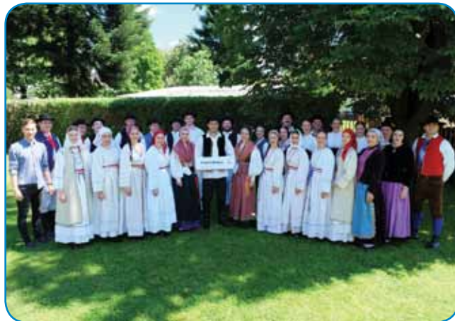
V kulturnom programi so večkrat zaplesali člani AFS France Marolt, šteri so poželi trno dosta aplavza

stavnom prostori Slovenskoga doma začnila plesna delavnica, na šteroj so mladi »Marolti« včili vseféle slovenske plesse najigr