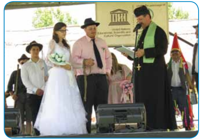
Zdavanje na odri. Pokrovitelj prireditve je bil UNESCO

Dva dneva od 9.00 do 18.00 vöre so vse skupine pri svojoj iži in na odri nutpokazale svojo erbo. »Busók« (kak kurenti) so fejšt švicali, ka so ranč tak bili nutnaravnjeni v birkeče kauže kak na fašenek. Bili sta eške dve fašenski skupini, šterivi sta vsikšoma obraz nutnamazali s sajami. Moški iz Karcaga so v enom kotli iz cejle birke golaž küjali. Ženske iz Kalocse in krajine Matyó pa Sárköz so mele na odri modno revijo iz lejši stari gvantov pa moderni gvantov s starimi mintami. Lončara sta bila dva: iz Magyarszombatfe in Mezötúra . Iz županije Szatmár so pripelali slivovi lekvar , štéri se küja brezi cukra. Ženske