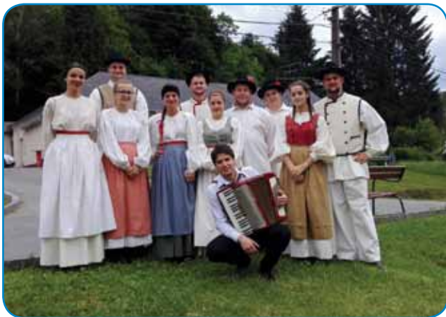
Domača folklorna skupina

Na binkoštno nedeljo – kljub slabemu vremenu – so se v lepem številu zbrali ljudje, ki so prišli tudi iz drugih vasic, na Gornjem Seniku, da bi ob plesu in petju podrli mlaj. Navzoče je pozdravila predsednica gornjeseniške slovenske samouprave, med