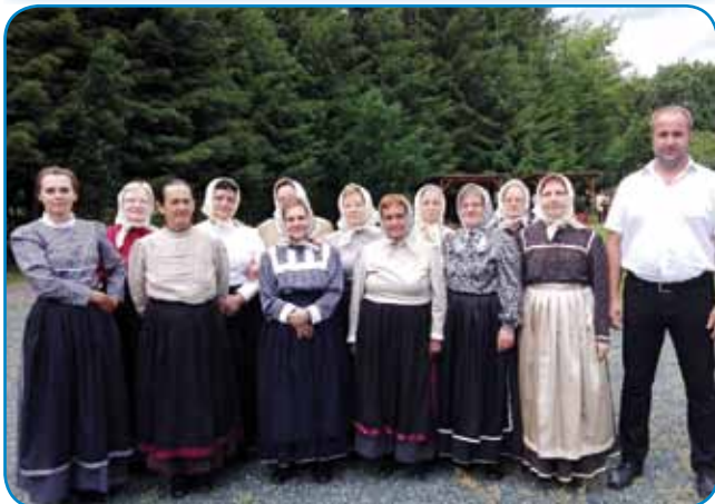
Folklorna skupina slovenskih upokojenk

njimi domačo folklorno skupino, folklorno skupino porabskih slovenskih upokojenk ter malčke in starše dvojezičnega vrtca na Gornjem Seniku. Član gornjeseniške slovenske samouprave in vodja domače folklorne skupine Andraž Sukič je izpostavil,