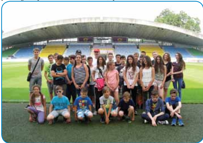
Skupinska slika na stadionu