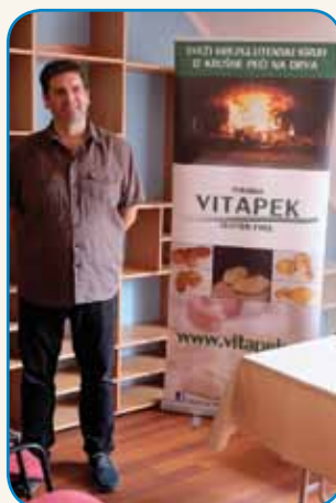
Brezglutenski kruhi iz krušne... stran 6