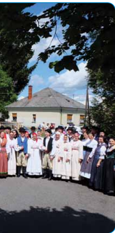
ri Slovenskoga doma

šina pa so »sestavni del sobivanja« ino »generator razvoja v medsebojnih odnosih«. Povódo je eške, ka badva sausednjiva rosaga »namenjata v duhu dobrososedskih in prijateljskih odnosov posebno pozornost izzivom, s katerimi se soočata