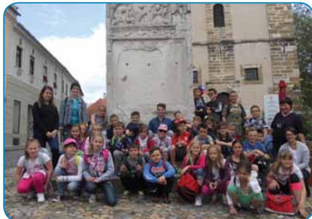
Mlajši učenci Gornjega Senika, skupaj z učitelji, ob Orfejevem spomeniku na Ptuj

hrbtniki sendvičev ter pijač so bili naši spremljevalci ob jutranjem odhodu z Gornjega Senika. Vsi skupaj smo se odpravili v isto smer – na Štajersko – le da je ene pot vodila v najstarejše mesto v Sloveniji, na Ptuj, drugi pa so se odpravili v prestolnico