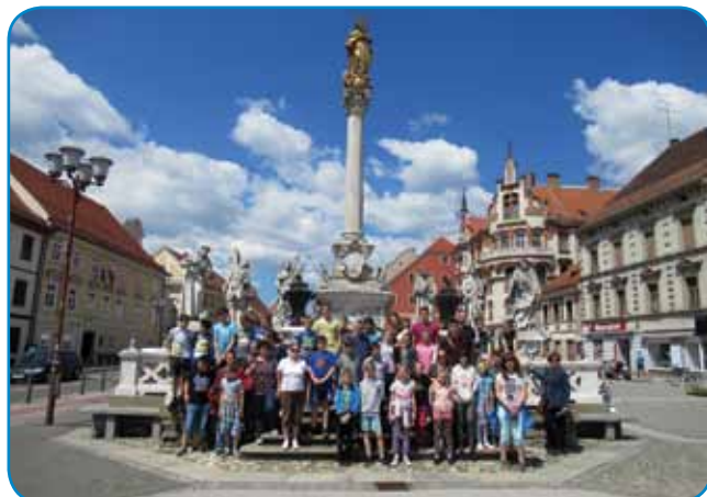
Učenci in učitelji predmetne stopnje pred kužnim znamenjem v centru Maribora

Štajerske, v Maribor. Cel dan sta bila z nami tudi turistična vodiča s turistične agencije Pütra iz Murske Sobote, ki sta