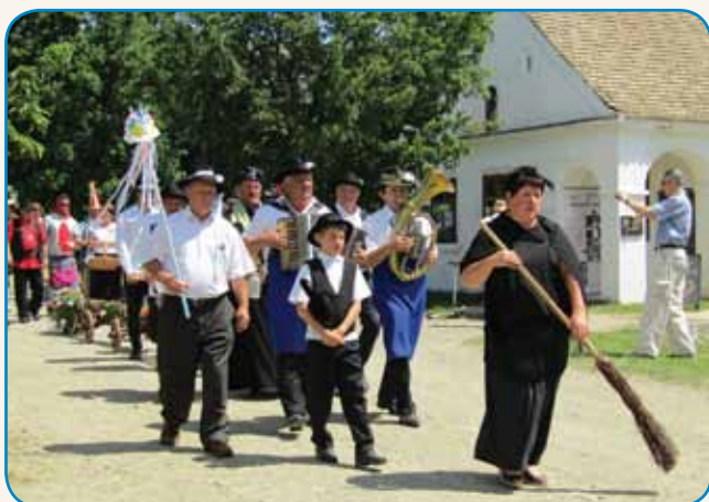
Borovo gostúvanje v Szentendri stran 10