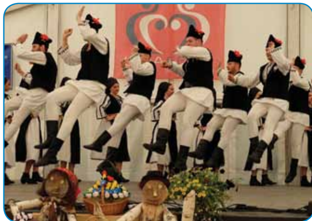
Skupina iz Romunije (Felvinc) se je tó vidla lidam

Spejvali pa djufkali pa so člani skupine »Doina Aiudului« z Romanarskoga tó, šteri so se koraž-