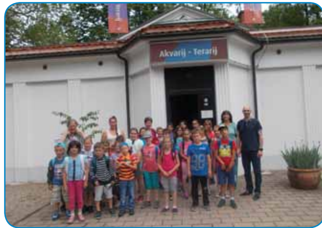
Pred Akvarijem v Mariboru

1. junija zjutraj ob osmi uri so se učenci od 1. do 4. razreda DOŠ Števanovci napotili na enodnevni izlet v Slovenijo. Cilj je bil spoznavanje Maribora in okolice. Z avtobusom smo se peljali po avtocesti do prestolnice Štajerske. Najprej smo se ustavili v parku in smo si ogledali Akvarij-terarij. V akvariju smo videli 120 različnih vrst rib in kač. Učenci so dobili zanimive informacije. Po ogledu akvarija smo nadaljevali pot v park. Spoznali smo le-