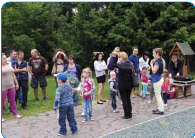
Prireditve se je udeležilo veliko mladih, saj so nastopili tudi malčki domačega vrtca