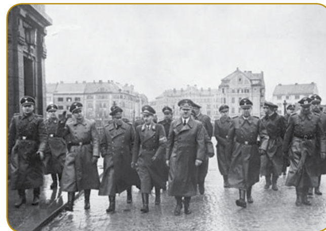
Adolf Hitler je po okupaciji gorpoisko Maribor pa pravo: »Napravite mi té rosag pá za nemškoga«

Stari slovenski političari pa so zmejs bili z drügimi voditeli Jugoslavije na zemlej pod britanskim pelanjom. Eške samo v geséni leta 1941 so kontaktirali svoje sodelavce v domovini, gda je zavolo OF situacija že ovaška bila. Tak liberalni kak katoličanjski političari so raj čakali, aktivna rabuka je nej bila v njenom programi.