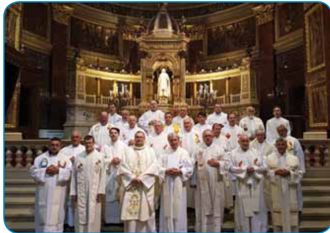
Cerkveni dostojanstveniki in župniki soboške škofije v baziliki sv. Štefana