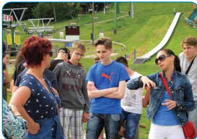
Med poslušanjem vodnice

je bil učencem med vsemi mariborskimi zanimivostmi najbolj všeč. V popoldanskih urah smo se polni vtisov, vsak je namreč izvedel in doživel kaj novega, odpravili nazaj