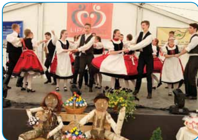
Mladi Varašanci, šteri plešejo v okviru šaule folklora Partium

lidam. Navzauči so spoznali bogato plesno kulturo Slovenije pa malo cujpomogli, gda se je plesala »rozinka« ali »ajncvjadraj«. Djenau v tom časi se je v šatoru prejkzeli válo za tau, ka so spej-