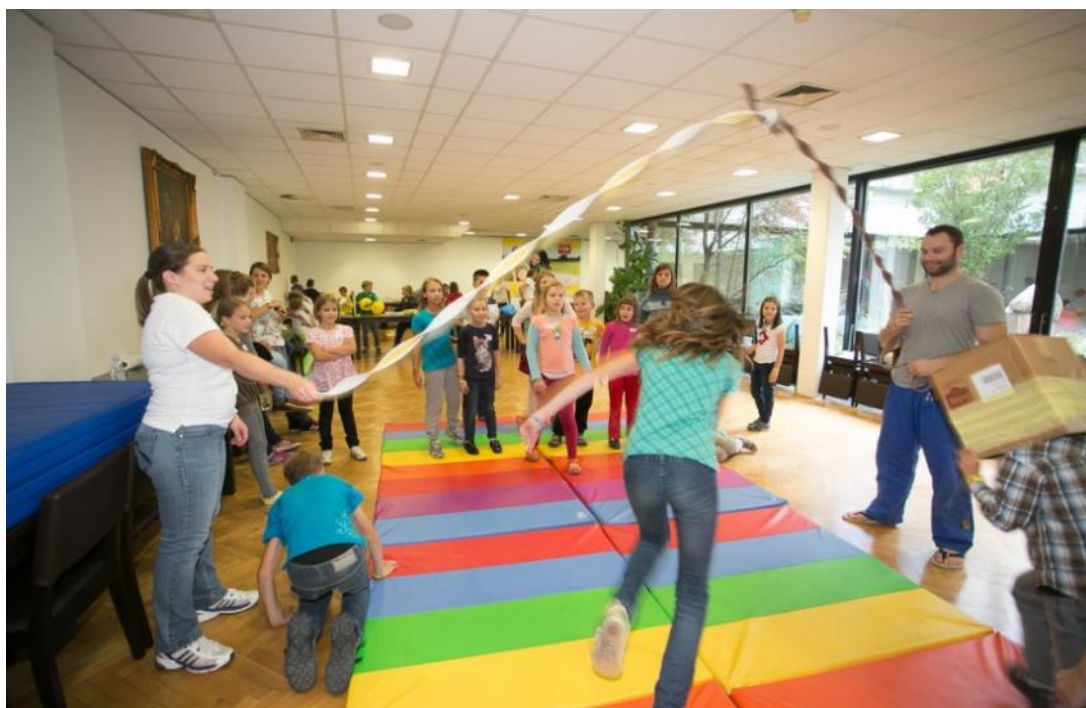
Na ljubljanskem dogodku ob svetovnem dnevu brez glutena konec septembra letos je IZIS izvedel otroške delavnice, na katere se je prijavilo 300 otrok.

čudovitih prostorov, od velike ustvarjalnice in manjše igralnice, opremljene po meri otrok, do telovadnice in ograjenega vrta z igrali. Srečanja so tematska, kar pomeni, da vsak dan v celoti posvetimo izbrani temi, ki jo spoznavamo z vseh mogočih, tudi nevsakdanjih ali neobičajnih vidikov. Na določeno temo se pogovarjamo, ustvarjamo, eksperimentiramo, se igramo igre vlog. Gre za interakcijo vseh prisotnih, vsako srečanje pa je seveda prilagojeno starostni strukturi udeleženi otrok. Do konca leta bomo tako na primer izvedli kemijsko delavnico z materiali, ki jih najdemo v vsaki povprečni domači shrambi, spo-