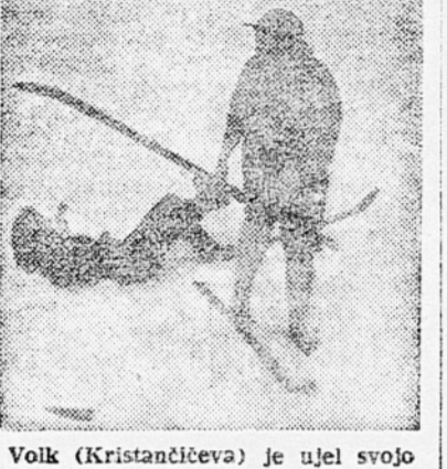
Volk (Kristantovičeva) je ujel svoj zriev (Jurhančičova)

»Vojčka pasta« Po opoldanskem počitku prične delo znova. Smučarji tek začenja od tekmovalke ne samo veliko tehnično znanje, smpak tudi vzdržljivost. K temu