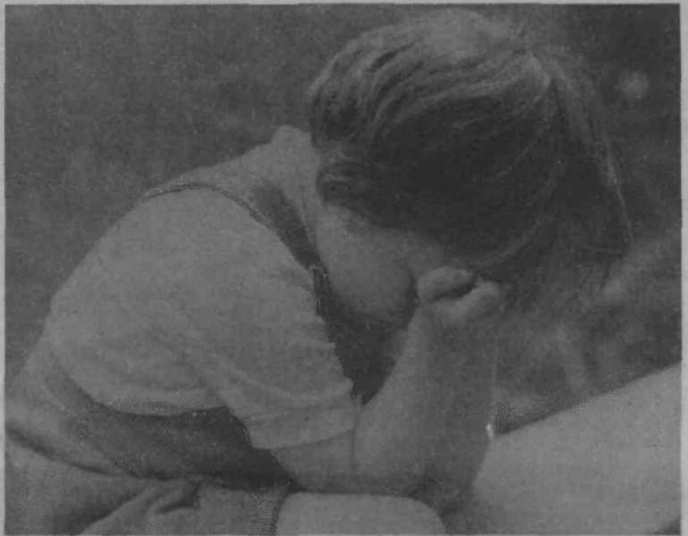
NJIHOVO LETO – Otroci so naše največje bogastvo. Sreča naših najmlajših je njihova pravica, naša dolžnost pa, da jim omogočimo brezskrbno mladost. Letošnje leto je posvečeno otrokom vsoga sveta ne glede na raso in narodnost, saj so malčki povsod enaki, le mi odrasli tega večkrat ne moremo razumeti. Pod geslom »Ustvarimo svojo srečo, da bomo omogočili srečno otroštvo našim otrokom!« bodo letos v Ljubljani potekale številne akcije, ki jih bo v sodelovanju z drugimi družbenopolitičnimi organizacijami pripravljala in usklajevala mestna Zveza prijateljev mladine.

Te dni potekajo v naši občini še zadnje volilne konference krajevnih organizacij SZDL, ki pomenijo, če uporabimo stereotipen izraz, prvo fazo organizacijske in politične utrditve te naše najbolj množične družbenopolitične organizacije. Čeprav volilna opravila v vseh krajevnih konferencah še niso končana in ker jim bo sledilo še konstituiranje na občinski, mestni in republiški ravni, že lahko zapišemo nekatere ugotovitve.