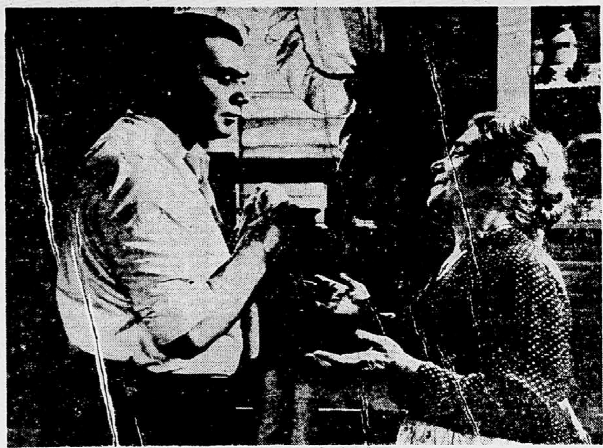
Prizor iz ameriškega filma »Marty«, ki je dobil za leto 1955 kar štiri Oscarje, in sicer kot najboljši film, Delbert Mann za režijo, Ernest Borgnine (levo na sliki) kot najboljši igralec, in Paddy Chayefsky za najboljši scenarij.

Sele sedaj se je snemale spomnil in zatemnil sliko. Vodja oddaje pa se je pri poslušalcih in gledalcih opravičil zaradi