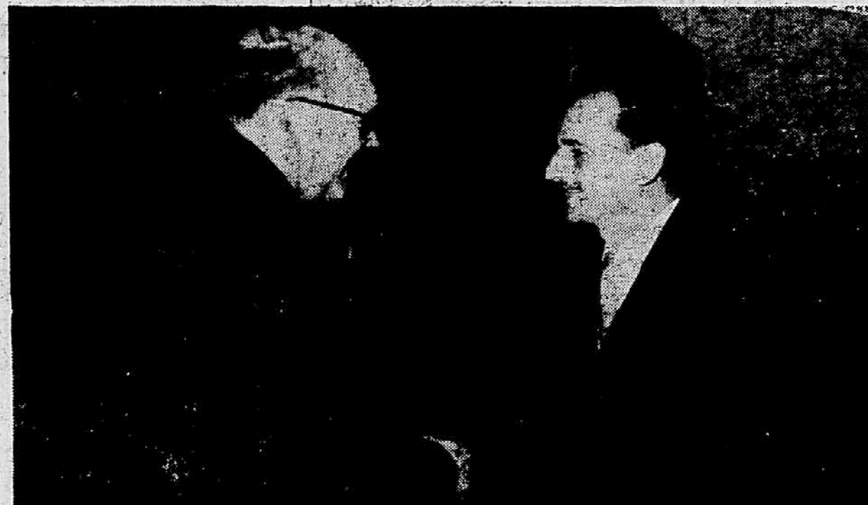
Kakor smo se poročali, je v Beograd prispel g. H. Spaak, belgijski zunanji minister, ki je gost državnega sekretariata za zunanje zadeve. Na sliki: G. H. Spaak se pozdravlja s državnim sekretarjem Kočo Popovičem.