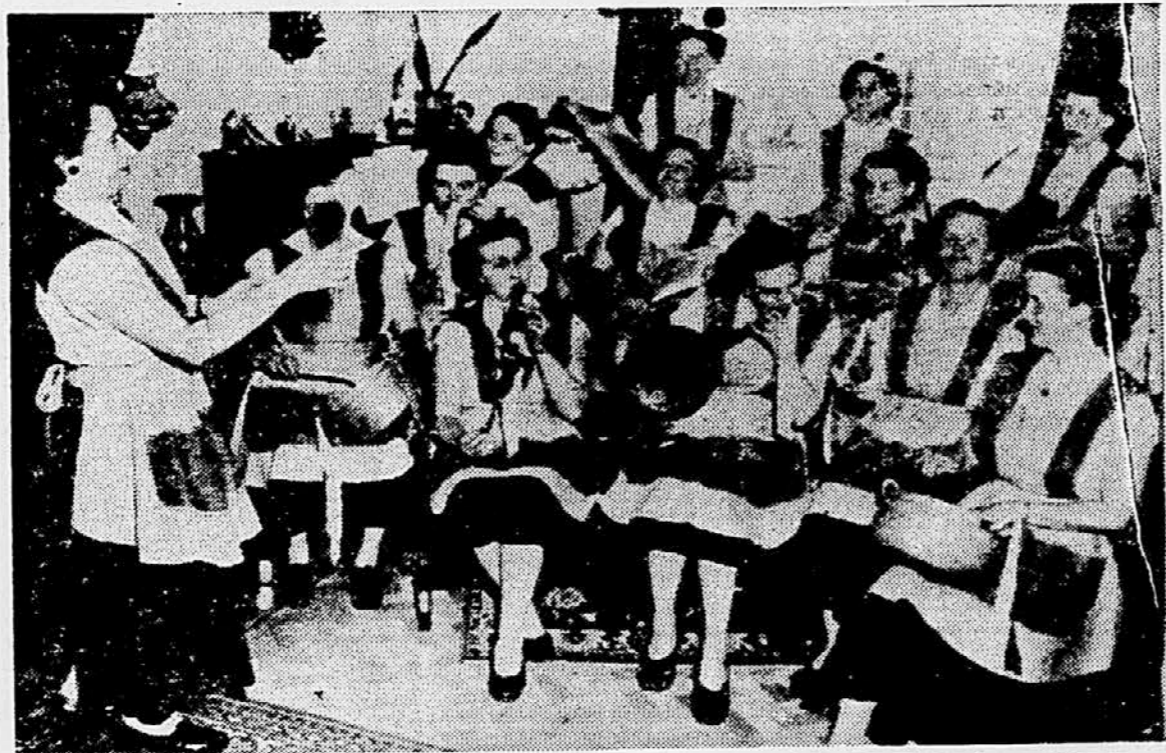
Ze lani smo poročali našim bralcem o gospodinskih orkestrih, ki jih imajo na Nizozemskem. Gospodinjje imajo svoje orkestre po vsej deželi, vendar je najbolj znani gospodarski orkester iz Utrechta, katerega vidimo na sliki. Navadne instrumente so gospodinjje zamenjale z lonci, kozicami, pokrivačami in kuhinjskimi. Ker pa takšni instrumenti ne dajejo najboljših melodij, sodeluje v orkestru tudi klavir, poleg tega pa gospodinjje na glas in od srca prepevajo. Na sliki: orkester v polni »akciji«.

išče za takojšnji nastop verzirano STROJEPISKO, po možnosti z znanjem stenografije. Zglasi se osebno ali pošlji pismene ponudbe na poštni predal 376. Ljubljana.