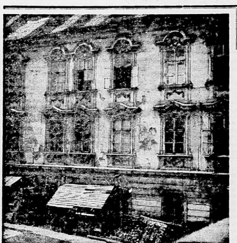
Tako je dvorišče Gruberjeve palače

V zvezi z letošnjo preusmeritvijo investicij na predelovalno industrijo in kmetijstvo je značilno, da so posamezne okrajne združene zveze naročile pri zavodu določena raziskovalna dela mineralnih surovin, ki so potrebna za kmetijstvo. Po teh načrtih bodo raziskovali kamnolome, ki vsebujejo železo ter kamnolome, ki so primerne za kalifikacijske zemljišč. Zaradi tega se je zavod opremil s vsami potrebnimi instrumenti za raziskovanje mineralnih surovin v kmetijstvu. Na področju inženirske geologije bodo raziskovali možnost fundacije hidrocentral na Dravi in na potočju Soče. Med drugim bodo raziskali temelje za gradnjo hidrocentralne. Ozbait prav tako bodo letos pričeli z nadaljnjimi raziskovalnimi deli na Dravi vzhodno od Maribora. Pri svojem delu bodo posvetili posebno pozornost izdelavi geoloških ekspertiz za fundacije mostov, cest predorov in drugih gradbenih objektov. Strokovnjaki Geološkega zavoda bodo za podjetje Elektroprojekt v Ljubljani geološko raziskali terena v LR Črni gori, da bi ugotovili možnosti za gradnjo hidrocentral na črnogorskih re-