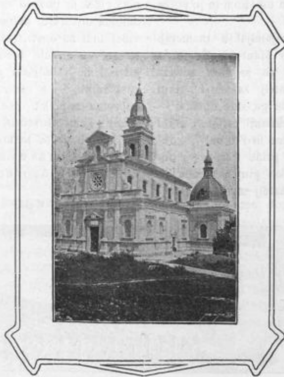
Cerkev na Brezjah.

mogel zaradi zopetnega nasprotovanja italijanske vlade škofijsko stolico zasesti šele dne 13. maja l. 1897. Dne 5. decembra istega leta je tudi on poslal svoje prvo poročilo v Rim, iz katerega še marsikaj hvalnega izvemo o delovanju Sartovem, kar je ta sam v svoji ponižnosti zamolčal. Nasproti liberalnim judovskim časnikom je ustanovil škof Sarto katoliško-politični list „Il cittadino di Mantova“, ki je imel pa vsako leto izgubo, katero je moral škof iz svojega poravnati. Nasproti socialnim demokratom, ki so se bili že močno