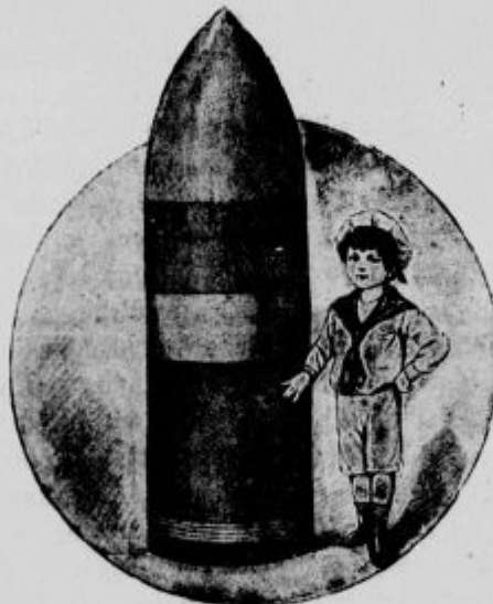
Granata obležnega topa izpred Port Arturja.