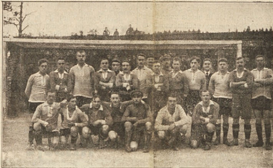
Moštvi Rapida (Dunaj) in SK Celja.