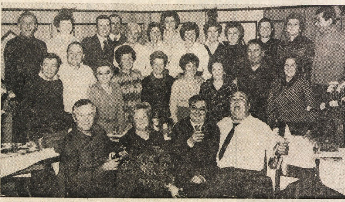
Obvezna fotografija za spomin na življenjski jubilej