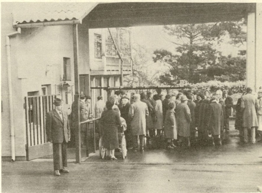
Spominski posnetek z lanskega prihoda v TOZD Specialne baterije v Sentvidu pri Stični je obenem vabilo na letošnje srečanje upokojenec, ki bo v četrtek 19. decembra letos v ljubljanskem ZMAJU.