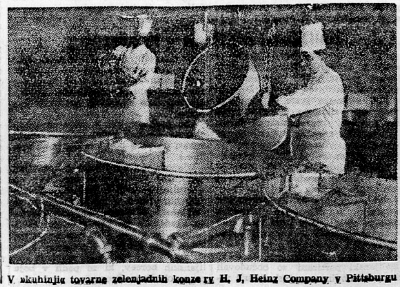
V skuhinju tovarne zelenjadnih konzerv H. J. Heinz Company v Pittsburgu

blane, je zasajena s srednjevisokim drevjem, ki ima veje čisto go tal. Pokazali so nam razne vrste motornih škroplilnic, od katerih se nekatere premikajo na gosenicah, druge pa na kolesih. Te škroplilnice s tako silo pokropijo drevesa, da jih naravnost operajo. Pod drevjem pa raste trava. Lastnik sam ne dela, temveč zaposluje primerno število ljudi, ki mu oprav-