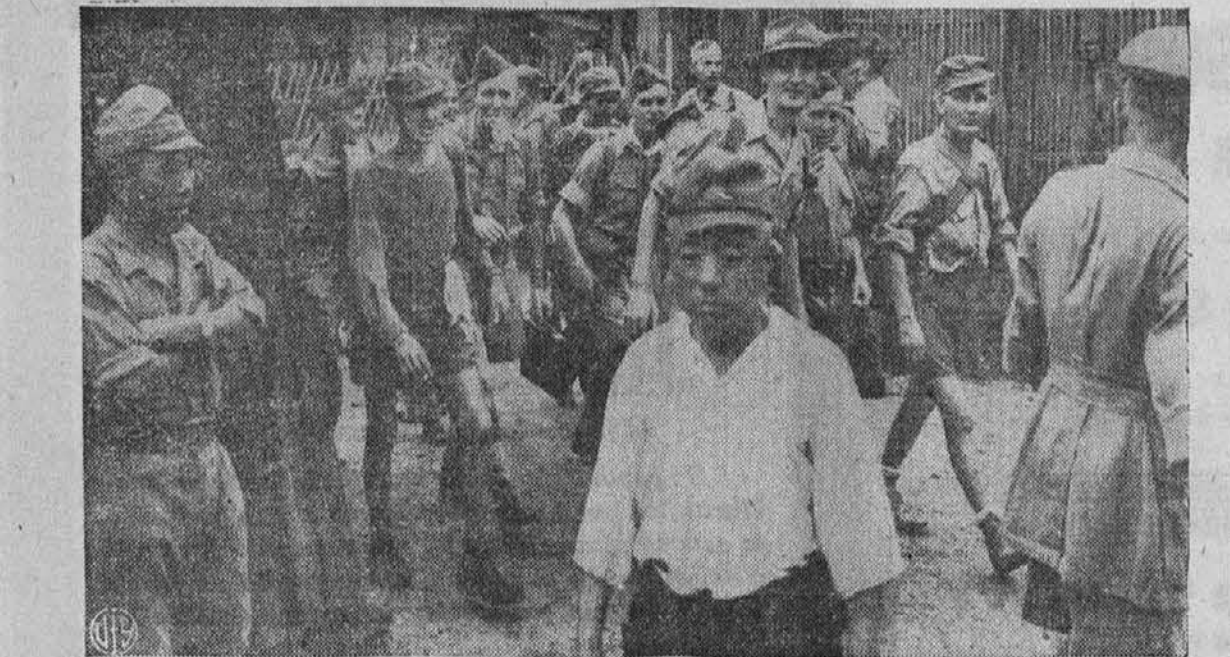
Končno le svobodni. — Veselje in zadovoljstvo je brati na obrazih angleških in avstralskih vojnih ujetnikov, ko so bili osvobojeni iz japonskega vojnega ujetništva na Formosi. Veliko nasprotje pa je videti na obrazih japonskih stražnikov, ki se kaj kisto drže. Ti ujetniki so bili v tem taborišču na tri leta in pol.

Ako bo stala vožnja z letalom v Evropo in nazaj $200, bo ob-iskalo Evropo vsako leto do 4,000,000 Amerikancev, ki bodo potrošili tam do 1 milijona ame-riških dolarjev.