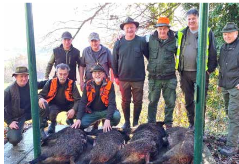
Z enega od ulovov na divjega prašiča