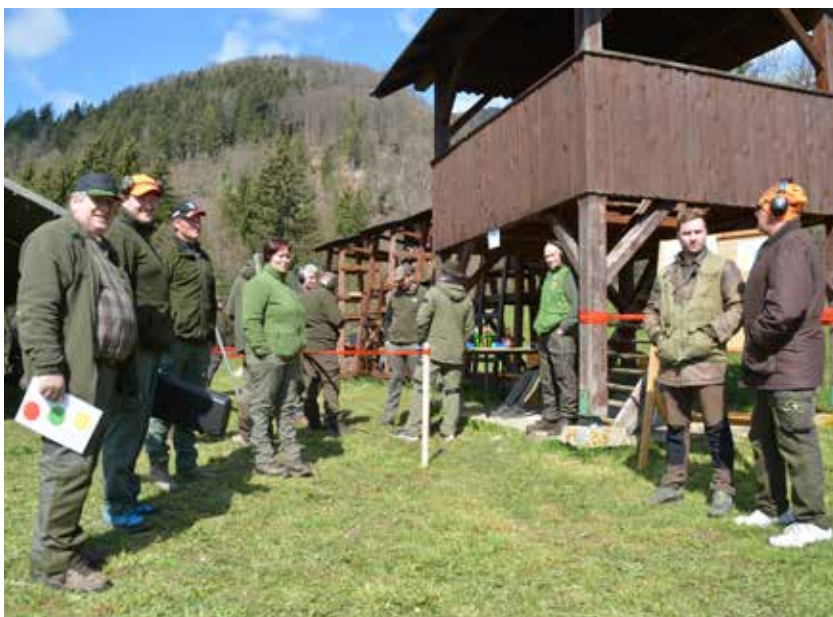
Del udeležencev med čakanjem na svoj strelski nastop

Lovsko strelstvo ima v Lovski družini Vransko dolgoletno tradicijo. Vrsto let so se strelske tekme izvajale na Orehovcu, pri stari lovski koči, kjer je bilo urejeno strelišče za tri strelske discipline. Po denacionalizacijski vrnitvi objekta lastniku so člani LD Vransko najprej na Tešovi zgradili nov lovski dom, poleg njega pa tudi strelišče. Veliko let so se strelske tekme izvajale v streljanju na glinaste golobe ter na tarčo srnjaka in prašiča z malokalibrsko puško. Prišla so leta, ko teh tekem ni bilo. Leta 2011 pa so se odločili, da strel-