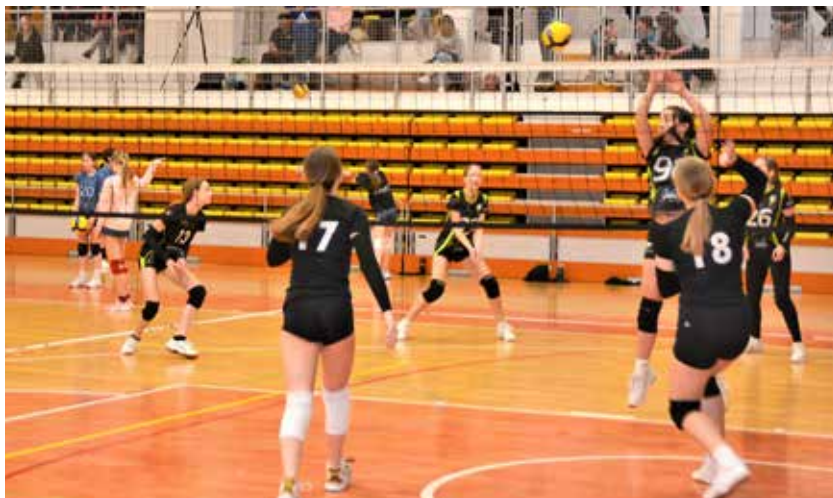
Iz tekmovanja v Preboldu, kjer je bil kot soorganizator OK Prebold