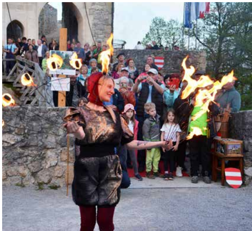
Ob tridesetletnici so ponovno pripravili bogat srednjeveški program.