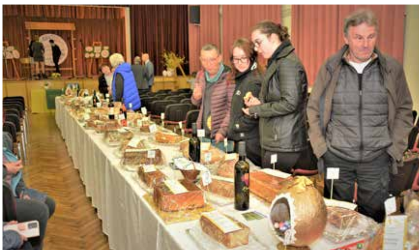
Razstava potic je bila tokrat skromnejša, saj je bilo skoraj pol manj potic kot minula leta.

Ocenjevalna komisija strokovnih in preizkušenih poznavalcev ter ocenjevalcev potic je letos štela devet članic in članov. Sestavljali so