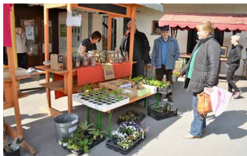
z bazarja s pesto ponudbo

tedenska kmečka tržnica; tokrat je bila tudi cvetlična, za nameček pa je potekal še sejem rabljene športne opreme in rekvizitov. Svoj doprinos pa so k dogajanju na bazarju prva dva dneva pridali tudi učenci OŠ Prebold in vrtčevski otroci.