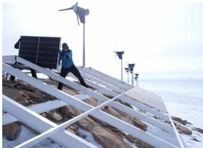
Montaža Bisolovih solarnih modelov na Antarktiki

V Latkovi vasi pri Preboldu izdelani solarni moduli bodo skrbeli za napajanje prve brezogljicne raziskovalne postaje na Antarktiki.