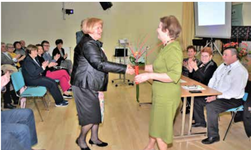
Med podajanjem cvetličnih aranžmajev v zahvalo za prizadevno delo v minulem letu

Univerza za tretje življenjsko obdobje Žalec ima 21 krožkov.