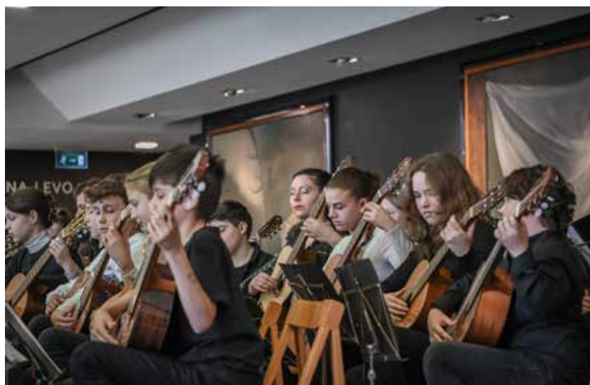
Dogodek je priložnost za druženje in izmenjavo izkušenj kitaristov iz vse Slovenije.