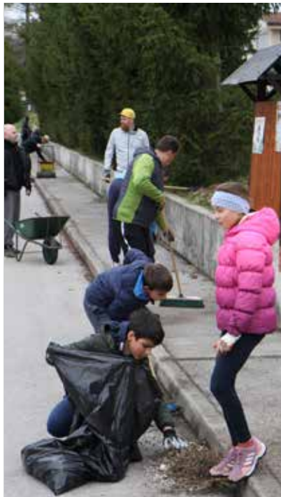
Z akcije na Polzeli v petek 24. in nedeljo 26. marca.

Čiščenje v Občini Braslovče je bilo tudi letos usmerjeno na robove cest,