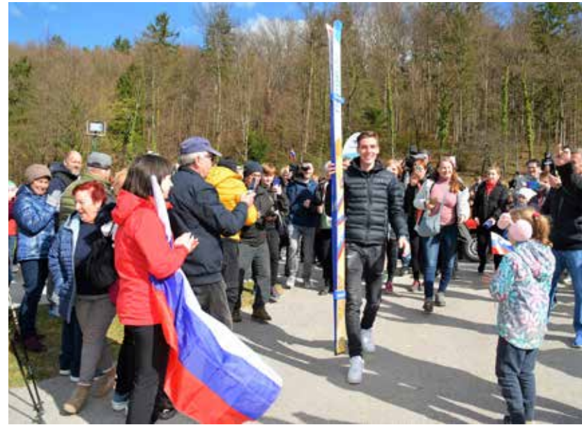
Pričakala ga je večstoglava množica, v špalirju se je sprehodil do odra.

čitve otroških sanj. Že kot otrok si nas navduševal s svojimi ambicijami; želel si slediti svojemu vzorniku Gregorju Schlierenzauerju – mogoče so bile takrat nepredstavljive, vendar si kljub težkim trenutkom, metanju polen pod noge, ob podpori svojih najbližjih ter s svojo predanostjo, pogumom in zagnanostjo dosegel to, kar zmorejo samo najboljši. Svojo polico z medaljami in pokali si hitro polnil že kot mladinec. Zadovoljil si se samo z najzlahtnejšimi, vedno si želel biti najboljši in to miselnost si prenesel tudi v svetovni pokal. Tvoja vztrajnost in neizmerna požrtvovalnost sta te pripeljali do svetovnega vrha – v dveh sezonah si osvojil