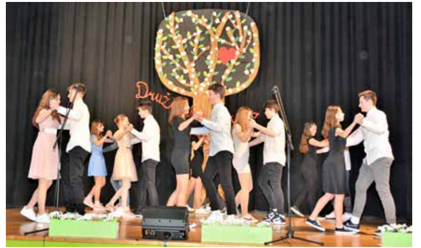
Devetošolci med plesom angleškega valčka

Na sobotni ustvarjalnici so udeleženci prepogibali, svaljkali, gubali, kodrali, rezali krep papir, naučili so se izdelati različne oblike in vrste papirnatega cvetja. Nastale so vrtnice, nageljni, tulipani ... in ustvarili so pomladno vzdušje.