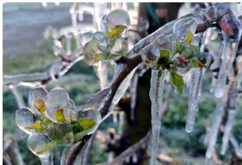
Plodiči po oroševanju

Škodo bodo lahko ocenili šele v prihodnjih tednih, ko bosta zaključena cvetenje in odpadanje plodičev.