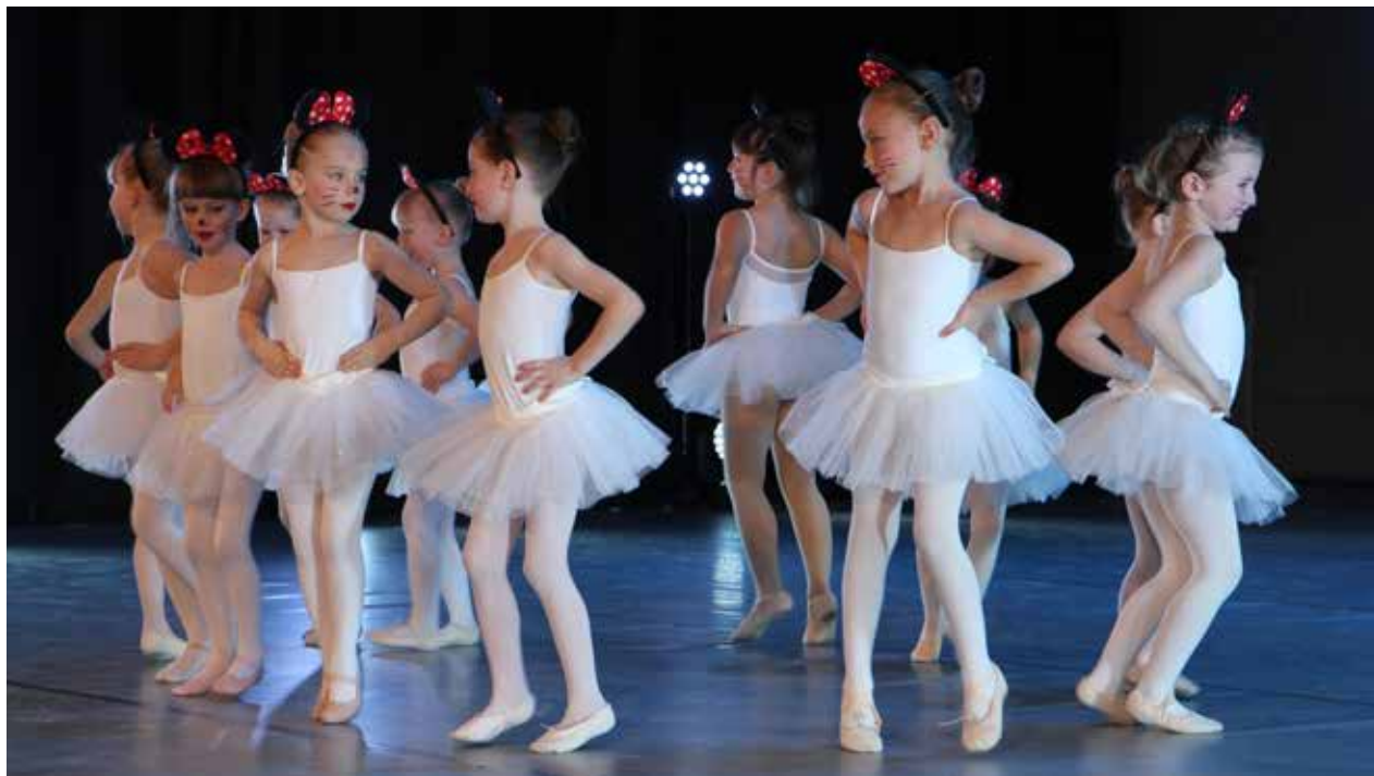
Najmlajše baletke v deželi miške