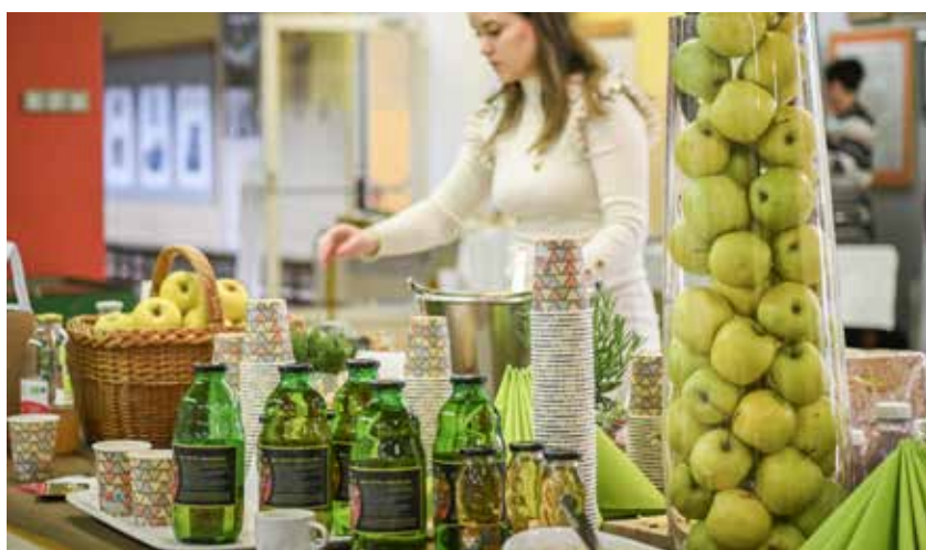
Bogata pogostitev, ki so jo pripravili v avli šole.

V četrtek, 13. aprila, so na prireditvi ob 20. obletnici delovanja Ekošole na I. OŠ Žalec pripravili slovesnost, na kateri so podpisali prenovljeno ekolistino, s katero so vključeni v široko mrežo ekošol v Sloveniji in v Evropi.