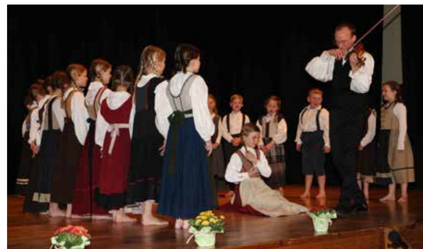
Otroška folklorna skupina POŠ Trje