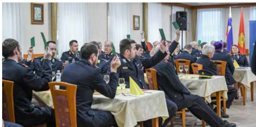
Glasovanja so bila precej soglasna.

21. aprila so se v gostišču Rimljan v Šempetru zbrali gasilci na 68. skupščini Gasilske zveze Žalec.