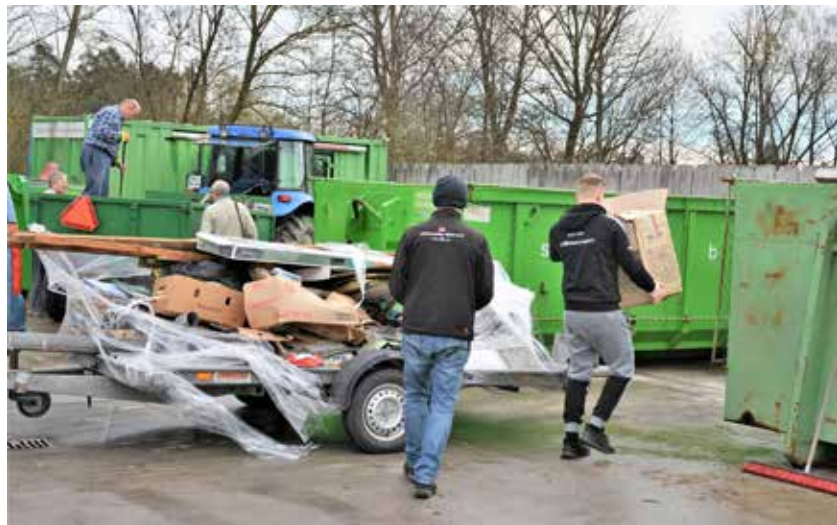
Po zaslugi zbirnega centra v Latkovi vasi, otokov za sortirane odpadke v vseh krajih v občini in večje zavesti ljudi za ohranjanje lepega okolja je tako manj onesnaževanja, okolje pa je lepše.

krajevni odborov. S čiščenjem se je sprijelo kar precej občanov, ki so pobrali odpadke po svojih vaseh, ob vodotokih in cestah ter v zbirni center v Latkovi vasi pripeljali kar nekaj traktorskih prikolic. Marsikdo je tja pripeljal odpadke tudi iz svojega domačega okolja, tako da je bilo zbranih odpadkov še toliko več. Na splošno pa je v primerjavi s preteklimi leti odpadkov bistveno manj, saj je osveščenost ljudi bistveno višja kot pred desetimi ali dvajsetimi leti. Svoje čistilne akcije pa so imeli tudi v nekaterih društvih, tako da je tudi letošnje pomladno čiščenje občine bilo uspešno izpeljano. V zbirnem centru v Latkovi vasi so pri raztovarjanju prikolic in sortiranju odpadkov