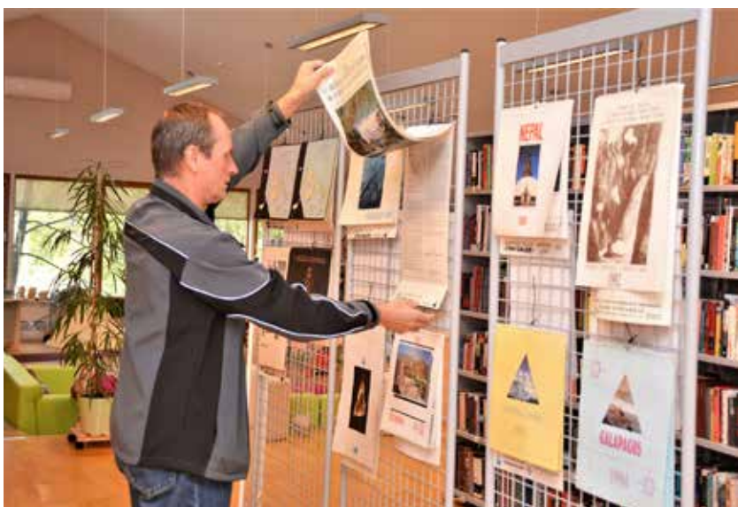
Med listanjem koledarjev, ki odkrivajo bogastvo doživetij jamarjev.