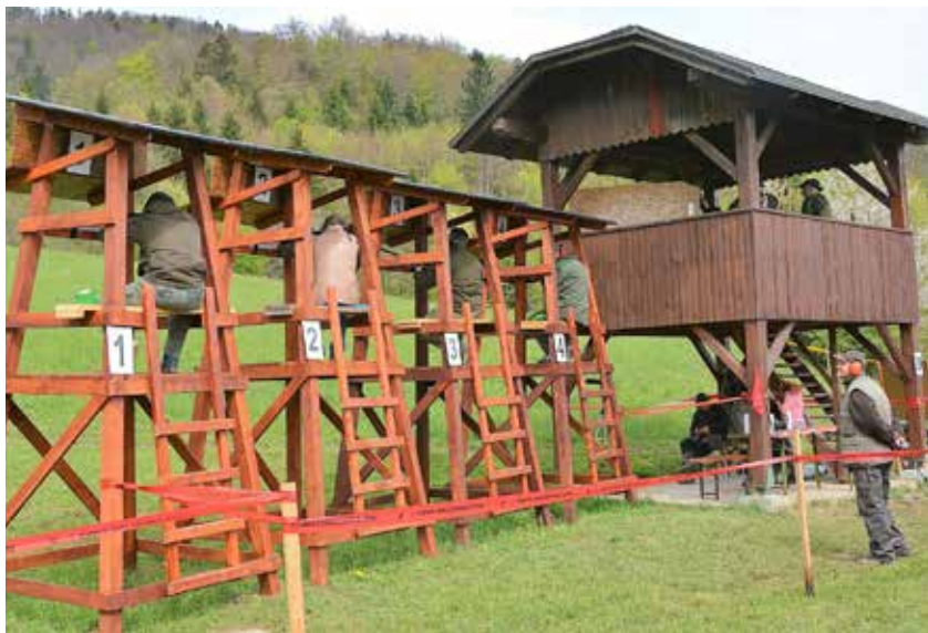
Tekmovalci na svojih strelskih položajih

Idejo za streljanje so na papirnato tarčo z narisanimi raznobarvnimi pirhi so lovci LD Vransko dobili na avstrijskem Koroškem pred mnogimi leti.