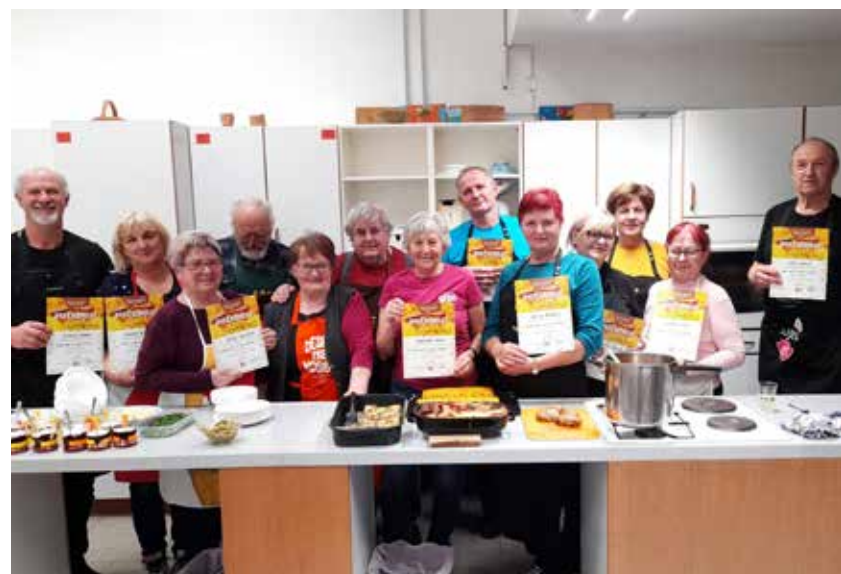
Udeleženci gobarske delavnice