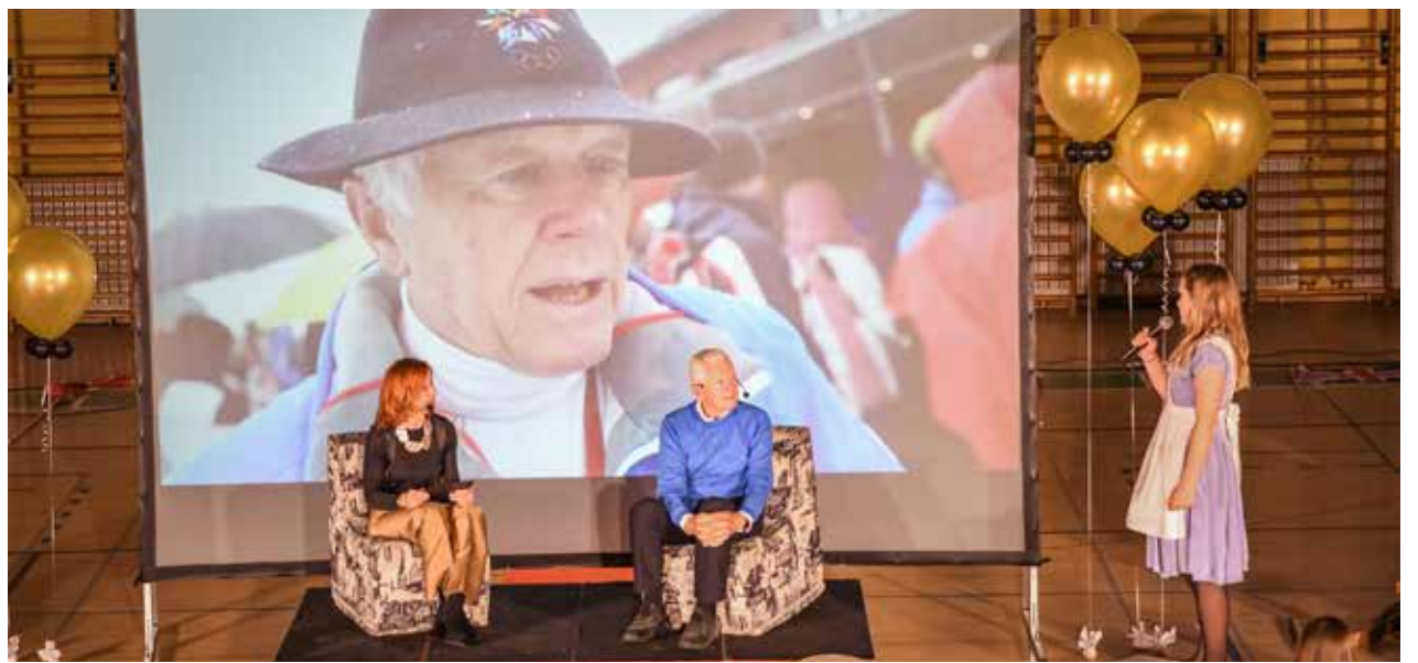
Na pogostitvi so postregli s sveže stisnjnim sokom iz izbranega sadja in zelenjave.

nih kosov stare smučarske opreme in oblačil tudi sam dobro spomni. Povezovalka ga je opisala kot človeka, ki je osupnil ves svet, človeka ki je neverjetno prodornostjo in vizionarstvom, ki je z mladimi talentiranimi smučarji osvajal svet. Ko mu je predala besedo, je vidno ganjen dejal, da je ostal brez besed ob takšnem mogočnem sprejemu. Med drugim je na vprašanje, zakaj so mu pravili, da je oče slovenske smučarske pravljice, povedal: »Če se spomnim teh časov, ne morem verjeti, kako sta tehnologija in izdelava smuči napredovali. Prve smuči sem imel lesene, bile so mamine. Smučalo se je v glavnem po globokem snegu. S takimi smučmi sem šel na prvo tekmo v svojem življenju, to je bil tek za otroke v mestnem parku v Mariboru. Takrat te smuči niso imele nobenih robnikov. Kasneje pa je bilo smučarsko orodje izdelano čedalje bolj precizno in prve moje resne smuči so bile slovenske izdelave. Takrat so bili v Sloveniji glavni izdelovalci smuči podjetje Elan ter trije privatniki: Mizarstvo Šipek iz