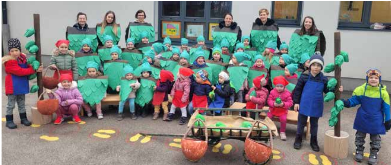
Množična ekomaska Zeleno zlato iz vrtcev Novo Celje

Horoskop je pripravila astrologinja Dolores, (090 64 30 in 041 519 265 ter Facebook dolores astro).