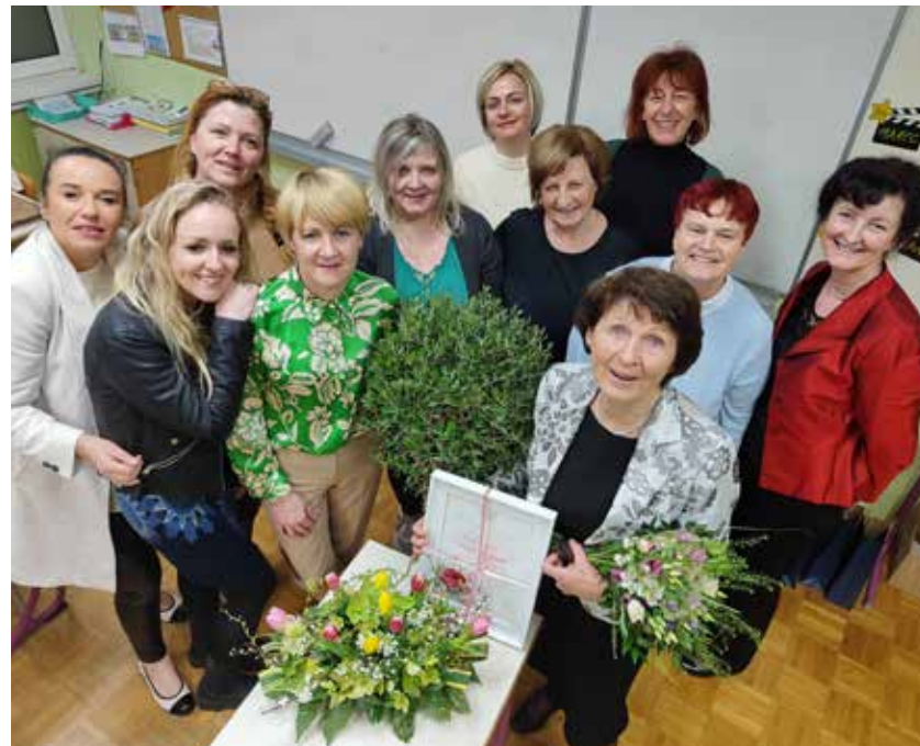
Upravni odbor TD Petrovče s sedanjo in nekdanjo predsednico v ospredju.

O tem, kako uspešni so bili v preteklosti, so v svojih nagovorih poudarjali tudi številni gostje in na koncu še zaželeli uspešno delo novemu vodstvu. Še pred tam sta nekdanja in sedanja predsednica podelili različna društvena priznanja.