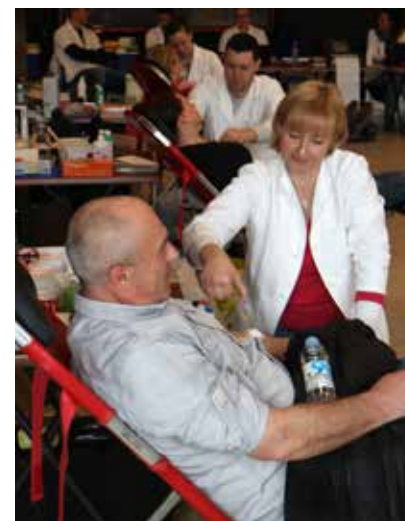
Z akcije v avli Doma II. slovenskega tabora v Žalcu

nah. Na našem območju bo naslednja krvodajalska akcija v Hotelu Prebold v četrtek, 8. junija, od 7. do 10. ure.