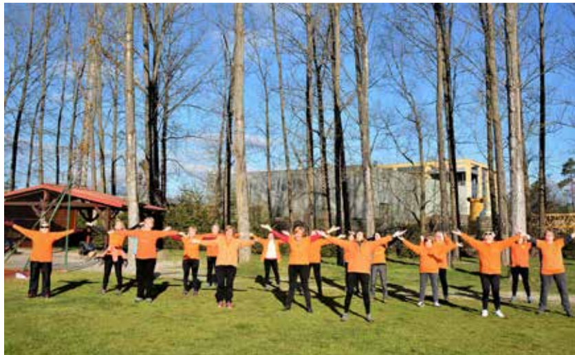
Skupina med vadbo

V Občini Prebold delujeta dve skupini Šole zdravja. Ena se vsako jutro zbere v preboldskem Gaju, druga pa pri športnem parku v Latkovi vasi ob Savinji.