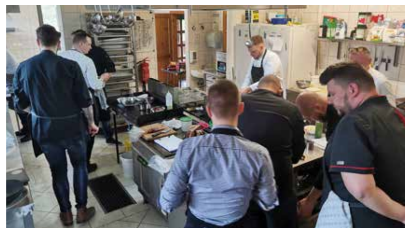
Z delavnice v Parizljah

Ekipa kuharskih chefov je v restavraciji Nova rajngla pri ribnikih Preserje v Braslovčah izpeljala delavnico z naslovom Promenada okusov Žovnek 2023 – iz kuhinje gospodov Žovneških, ki nekako