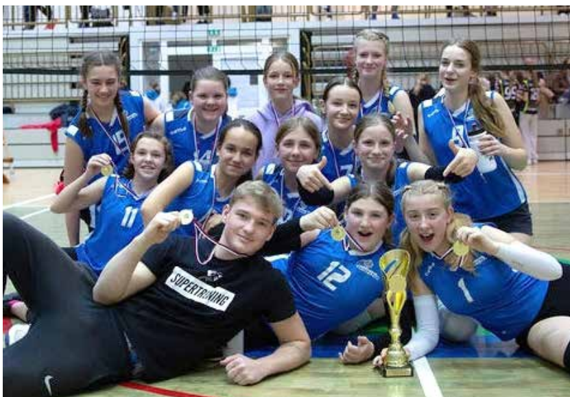
Ekipa začetnic SIP Šempeter II, ki je med 24 ekipami osvojila prvo mesto.