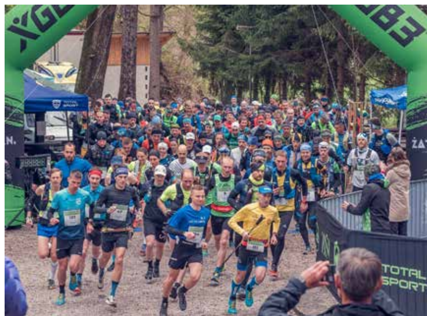
Start v Migojnicah

V petek, 14. aprila, so pripravili deveti Kronometer na Bukovico, dan kasneje, v soboto, 15. aprila, pa je potekal Savinjski K6 trail, oba skupaj pod imenom Vikend festival pohodništva in gorskega teka.