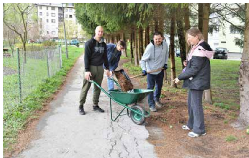
Del udeležencev med čiščenjem v blokovskem naselju Na zelenici v Preboldu

V čistilni akciji Občine Polzela je sodelovalo okoli 1000 udeležencev. Največ se jih je udeležilo iz vrst lokalnih društev, klubov, organizacij, iz osnovne šole in vrtca. Skupaj so zbrali