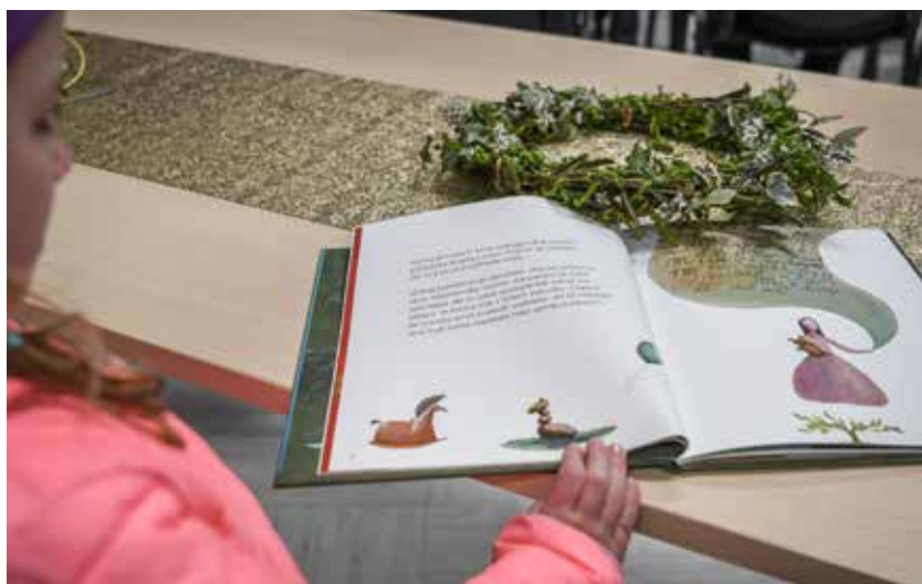
Slikanica je namenjena otrokom in odraslim.