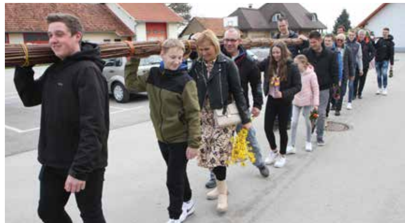
Vaščani Drešnji vasi letos zopet z butaro velikanko