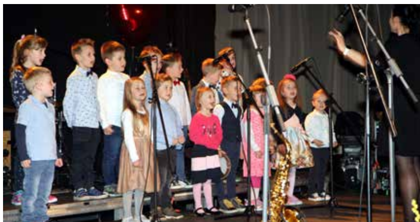
Zapeli so tudi otroci vrtca Polzela