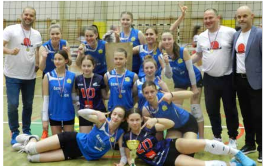
Šempetrska šolska odbojcarska ekipa po zmagi