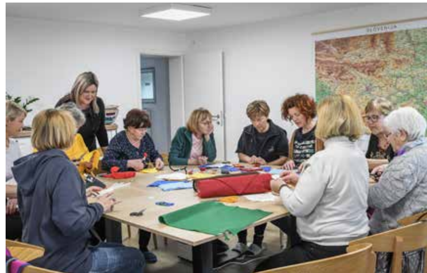
Ustvarjalnica izdelovanja rož