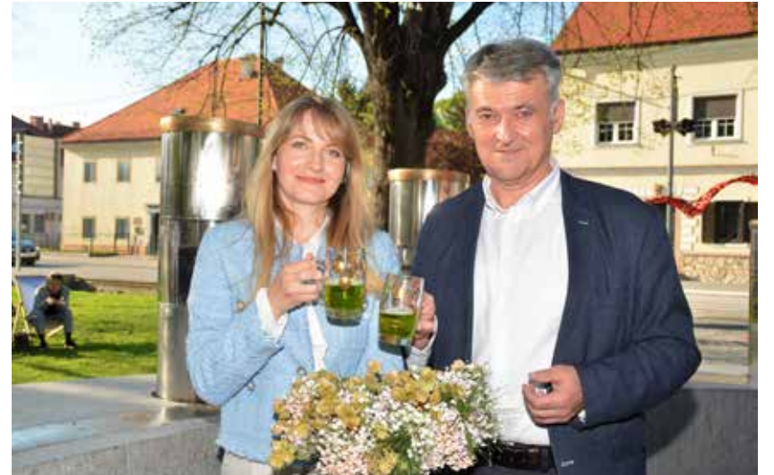
Župan in ambasadorka vsak s svojim vrčkom, ki omogoča neomejeno uporabo.

Oder je nato zavzela dalmatinska klapa Bunari in med občinstvo ponesla pridih morja in sonca iz njihovega Biograda. V nosnice pa tudi vonj po pečenih morskih ribah – sardelah, ki so jih na stojnici pekli in brezplačno delili gostje iz Biograda. Bunari so s svojimi pesmimi razveseljevali občinstvo, ki je lahko sodelovalo tudi pri zanimivi nagradni igri: iskanju hrvaško-slovenskega para, ki naj bi z združitvijo v eno predstavljaval spoštovanje, razumevanje in ljubezen, ki ne pozna meja – od