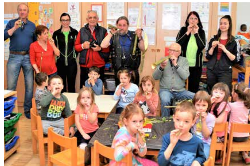
Ob zaključku druženja so vsi skupaj zapiskali v svoje piščali.