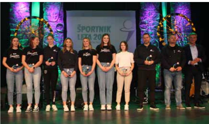
Naj ekipa za leto 2022 je članska ekipa OK Šempeter.

158 prejemnikov priznanj za leto 2022 v Občini Žalec je dosegalo odlične rezultate v posamični in ekipni konkurenci v vseh starostnih kategorijah, od najmlajših do veteranov, v zanimivo široki paleti športov, v zimskih in poletnih športih ter v šahu. Njihovi rezultati so odmevali v atletiki, borilnih veščinah (judo, karate, ju jitsu, taekvando), odbojki, rokometu, nogometu, košarki, namiznem tenisu, lokostrelstvu, jadrnanju, kartingu, orientaciji in planinstvu, alpskem smučanju, smučarskih skokih, hitrostnem drsanju in hokeju.