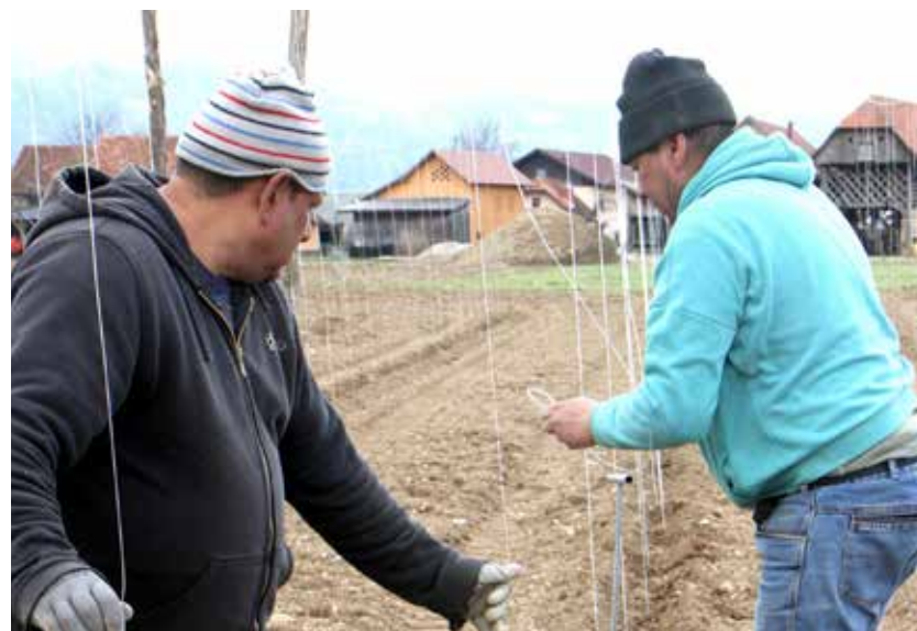
Pri napeljavi vrvic na breškem polju

Škoda bo najbrž ogromna, ocenili pa jo bodo lahko šele v prihodnjih tednih, ko bosta zaključena cvetenje in odpadanje plodičev. Jabolka sicer na Mirošanu pridelujejo na površini okoli 140 hektarjev s potencialnim letnim pridelkom 6.000 ton.«