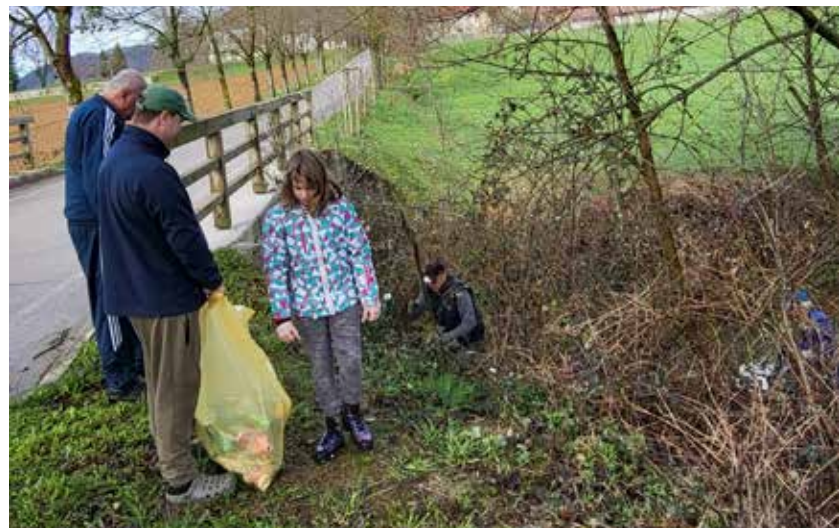
Z akcije pobiranja odpadkov ob cesti proti Žovneku

okrog 28 m 3 mešanih odpadkov, od tega največ plastike. Tehnična ekipa iz občinskega režijskega obrata je priskočila na pomoč z razdeljevanjem zaščitnih rokavic, vrečk za smeti ter sendvičev in vode za vse sodelujoče ter za sproten odvoz zbranih odpadkov v zbirni center Simbio v Andraž nad Polzelo. V Občini Polzela so veseli, da je odpadkov vse manj in da divjih odlagališč skoraj več ni, so pa ceste in poti še vedno odlagališče za marsikoga.