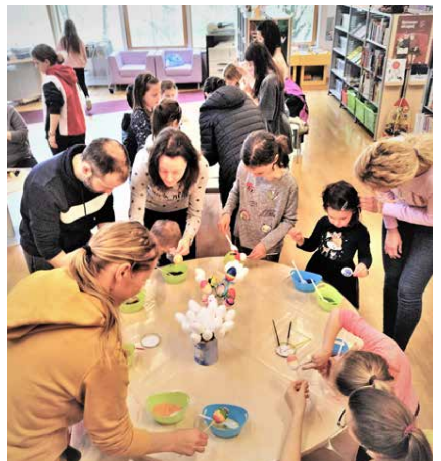
Udeleženci med ustvarjanjem

Nastalo je kar 200 izvornih, živopisanih dekorativnih jajc, ki so kot simboli pomladi, prijateljstva in ljubezni popestrila marsikateri dom in polepšala skupne praznične trenutke.