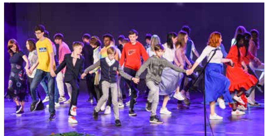
Nastopi otrok so občinstvu zelo nazorno predstavili tako vsebinsko kot tudi konceptualno širino waldorfske pedagogike.