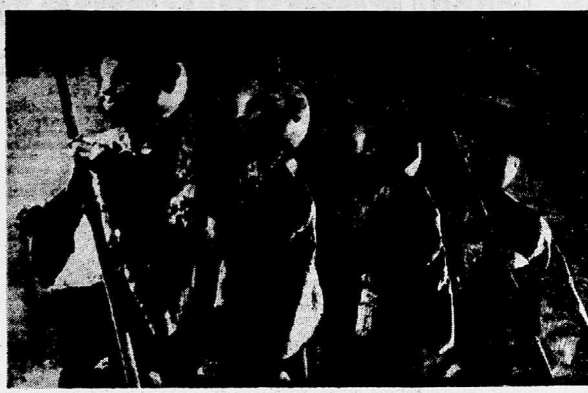
Mandarin na pobedu — prvor iz čelinske celovečernega barvnega lutkovnega filma »Cesarjev slavček«, kateremu so podelili v ZDA medalje za najboljši tuji film.

REAKTIVNA LADJA NA SAVI. Na zagrebški velesejmi so izvedli obiskovalni predložki videti prvi reaktivni ladje. Ta ladja ima napravo, ki črpa vodo v sprememni delu in jo meča za seboj ter vosi tako naprej. Voda sega samo na 60 stopinj, in če jo vodo izpusti, ne, meča izpod sebe blizo in spod in si tako utira pot dalje. Ta ladja bo ostala v Zagrebu na savi in bo delala za potovanja. Podjetje za gradbeno dela na reki. POMEMEN REKORD. Na so spretnosti avtomobilov, ki so vsi obiskovalci s strani na novi dve velesejski izročili svojo potrdila, so ugotovili, da so preleteli nad 1.200.000 potnikov. Seveda ob obisku nad 800.000 ljudi in vse, kar je bilo predloženo, ker je vsak potnik, ki se je predložil na novi velesej, moral peljati tudi smaj. —