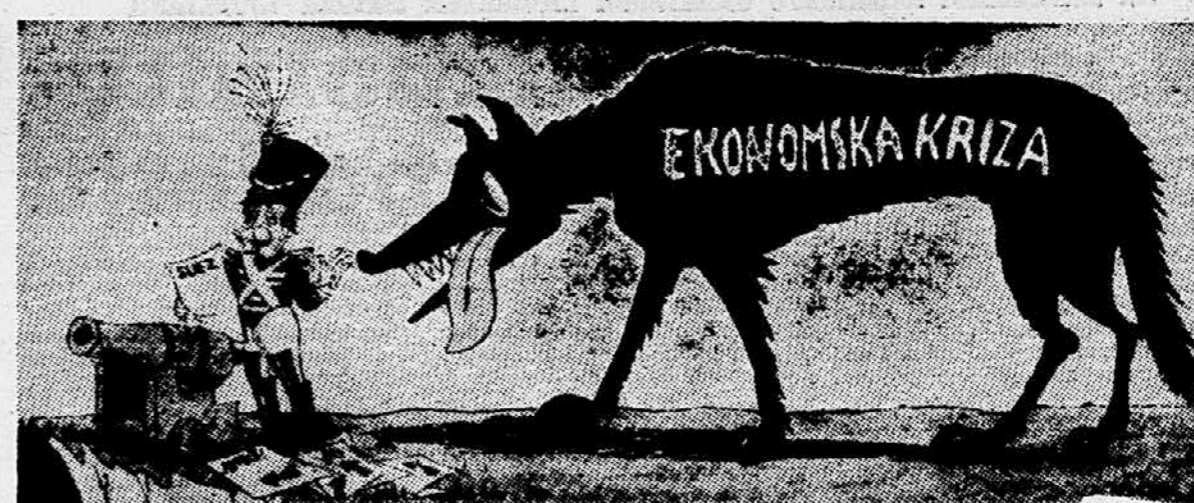
Fojdi proti! Ali ne vidis, da sem zaposlen

Razen tega, kar sem rekel, ne bi mogel povedati kaj več o tem, kako se razvija družbeno življenje. Ugotovljali smo obsežen aparat v političnih vodstvih, ki vodi in