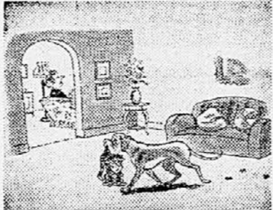
— Mihec, kaj si zopet pripeljal domov kakega izgubljenega psa?!

V Varšavi je pričakovala na letališču Kiepuro ogromna množica, ki ga ni pustila iz letala. Dokler ni zape! Ko je stopil iz letala, je množica zahtevala ponovitev, tako da je sedel pevec spredaj na »naupo« avtomobila in pel. No — tako je tudi poljske uradnike prepričal, da je res pravi Kiepura in so ga pustili brez potnega lista v mesto.