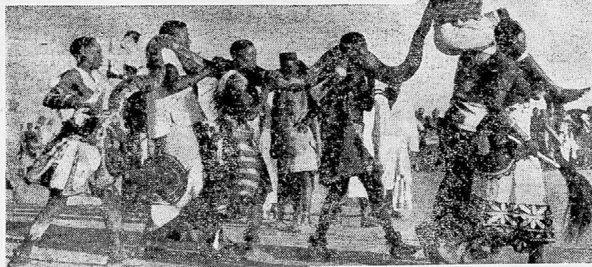
V Afriki praznujejo te dni »praznik žetve«. Na tem slavnju ne sme manjkati ljubljenska boga rodovitnosti Mulansu — velika kača, s katero se bojujejo najhrabrejši bojevniki in je pri tem ne smejo umoriti. Izbrpano kačo potem nesejo v slavnostnem mimohodu.

Ze več let se sestajajo strokovnjaki na mednarodnih kongresih, izdajajo časopise in dobivajo denarna sredstva za izpopolnjevanje strojev za prevajanje. Zadnje čase se trudijo z zamisljivo, da bi stroj