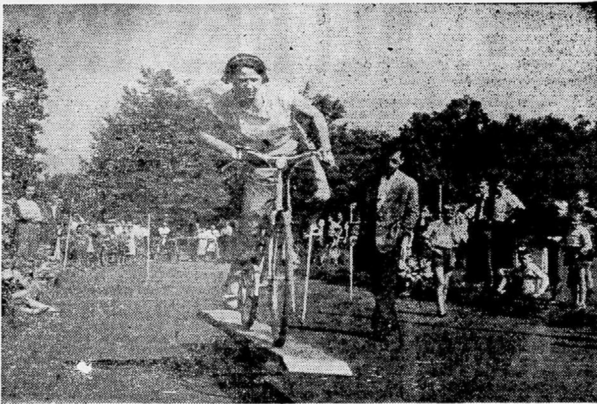
Kot smo že včeraj poročali, so v sredo praznovali v »Induplati« v Jaršah dvojni jubilej, in sicer 35-letnico obstoja tovarne in 8-letnico delavskega samoupravljanja. Ta dan so imeli v kolektivni tudi več športnih prireditvev in tekmovalj. Na sliki: kolesarsko tekmovanje po ovirah na športnem igrišču »Induplati«.

Na trgu v Spodnjem Hrastniku je sadije še vedno drago, čeprav je letos pri nas dobro obrodilo, prav tako tudi zelenjava. Vzrok je v tem, ker so zaprli trgovino s sadjem in zelenjavo v Spodnjem Hrastniku, saj je bilo prav v tej trgovini blago najcenejše. Sedaj, ko ni več trgovine, na hrastniškem trgu neprestano navijajo cene, saj ni več konkurence. Slišati je, da bo odprlo neko hrastniško trgovsko podjetje novo trgovino s sadjem in zelenjavo v Spodnjem Hrastniku, toda želeli bi bilo, da bi bilo to čimprej.