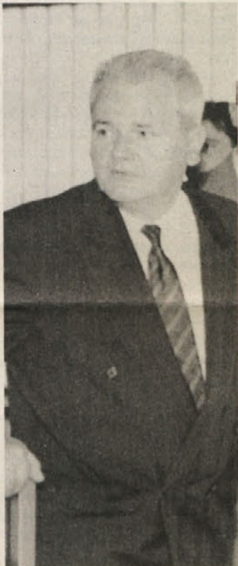
Slobodan Milošević na izmučenem srbskem konju trdno v sedlu

Tako je tudi sedaj. Bolj so obkroženi z nasprotniki, bolj jih stiska ekonomska blokada, več jih podpira svoje nacionalne voditelje – Miloševića, Šešlja, Arkana in Karadžića. Zunanji sovražnik je te srbske voditelje samo okrepil in opoziciji vzel ves veter iz jader. Kar bi bilo pred letom dni v Srbiji še mogoče – državni prevrat in demokratizacija –, je danes