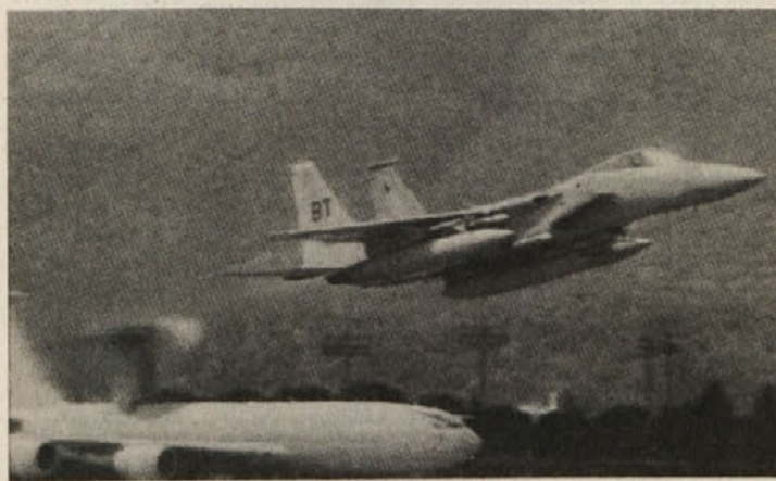
Koga nadzorujejo ameriška letala nad Bosno in Hercegovino?