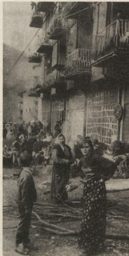
Bodo prebivalci Srebrenice preživeli?

Najbolj so zaradi namena novega neodvisnega radia zaskrbljeni na Hrvaškem, kajti bojijo se, da bi njihovi poslušalci slišali tudi kakšno drugačno vest, kot pa jo lahko v njihovih „neodvisnih“ režimskih medijih. Zato so Radio Ladja že označili za propagandista nekakšnega novega jugoslovanstva.