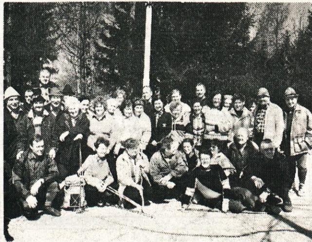
Pohodniki-planinci in upokoenci iz Kamnika, Komende in Moravč.

Vas vabi vsak dan, tudi ob sobotah in nedeljah, od 7. do 22. ure