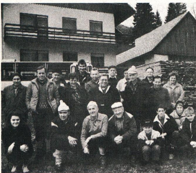
Kamniški planinci na Petrovem Brdu po povratku s Porezna