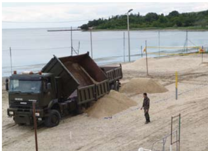
Vsako leto s pomočjo SV dobavimo 150 t kremenovega peska

Infrastrukturo odbojke, pa žal od leta 2006 hoče vodstvo MO Koper porušiti. V dveh sodnih postopkih smo uspeli s sodbami upravnega sodišča RS porušitev preprečiti. Neizmerno nam je pri tem veliko energije dala javna podpora športnih simpatizerjev in hrabra neposredna pomoč občanov Ankarana in posameznikov od drugod.