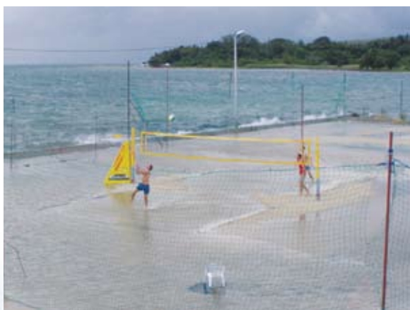
Plima nam odnaša mivko