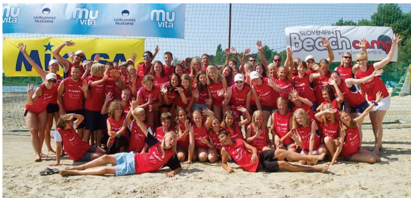
Šola odbojke na mivki

Dal 2004, quando si è tenuto il campionato europeo U-20 di pallavolo da spiaggia, stiamo assistendo a un costante aumento della sua popolarità e conseguentemente d'interesse pubblico. Le statistiche parlano di un costante aumento d'interesse nei confronti di questo sport. Annualmente abbiamo più di 6000 visitatori il che significa che qui da noi si sentono a proprio agio.