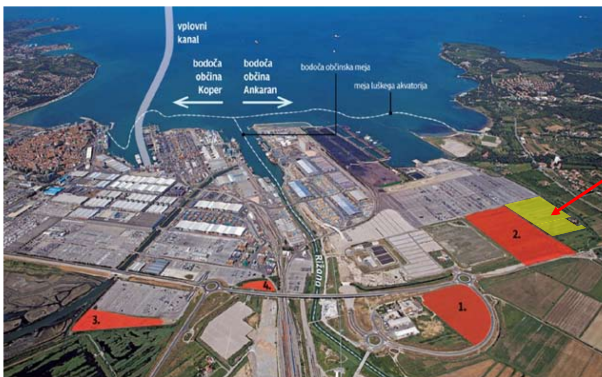
Slika 1: Kopenski del pristanišče na območju Mestne občine Koper in na območju Občine Ankaran

(2) Pobuda o odstopu oz. neodplačnem prenosu lastništva/uporabe dodatnih zemljišč za potrebe CODR na območju Občine Ankaran