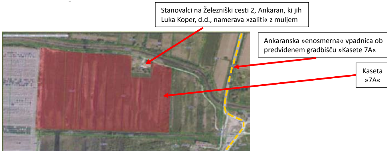
Slika 2: »Kasete 7A«: Nerazdeljeno skupno premoženje med občinama (MOK in OA) na območju Občine Ankaran

V postopku izdaje gradbenega dovoljenja si je Svet KS Ankaran prizadeval, da se ob ureditvi »Kasete 7A« za potrebe Luke Koper, d.d., zagotovijo tudi nadomestni bivanjski pogoji za stanovalce v neposredni bližini načrtovane gradnje, ter predlagal, da se ob ureditvi »Kasete 7A«, severni del ankaranske vpadnice med novozgrajenim krožiščem na ankaranski bonifiki in Jadransko cesto v dolžini cca 900 m, ki meji na načrtovano gradnjo, začasno razširi za cca 1,20 m in tako omogoči ponovno vzpostavitev normalnega dvosmernega prometa za avtomobile, kombinirana vozila, motoriste, kolesarje in kmetijske stroje, za kar je Svet KS Ankaran javno podal pobudo že dne 20.08.2013, a Mestna Občina Koper na uraden dopis KS Ankaran ni niti odgovorila.