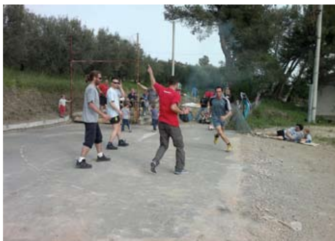
1.maj na porušenem športnem igrišču v Valdoltri

Ne glede na to, da so nam porušili igrišče, smo se 1. maja 2013 ponovno zbrali na igrišču oz. ostankih igrišča v Valdoltri. Kljub slabim razmeram smo izpeljali športno-kulturni program.