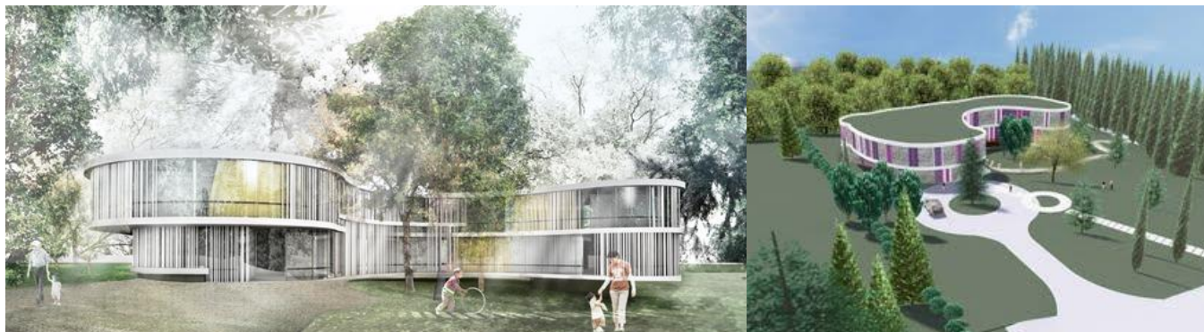
Slika 4: Načrtovani CODR območju Občine Ankaran

da je na svoji redni 17. seji dne 03.12.2013 med drugim obravnaval tudi nove okoliščine v povezavi z izvedbo projekta Centra Obala Debeli rtič (CODR) za otroke in osebe s posebnimi potrebami na območju Občine Ankaran in načrtovanimi aktivnostmi Republike Slovenije za odkup dodatnih zemljišč na območju Občine Ankaran za namen izgradnje dostopne poti in parkirišča ob novogradnji Centra Obala Debeli rtič.