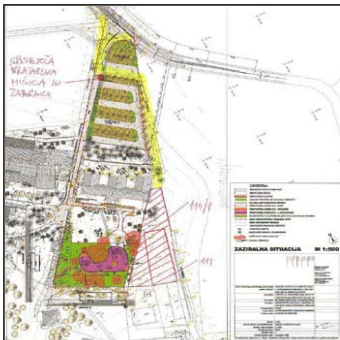
Slika 5: Dodatni parceli št. 111 in 114/1 k.o. Oltra za potrebe CODR na območju Občina Ankaran

V povezavi z načrtovanim odkupom potrebnih dodatnih zemljišč na Območju Občine Ankaran, Svet KS Ankaran ocenjuje, da je v obdobju in v okoliščinah globoke gospodarske in finančne krize ter zmanjševanju proračunskih sredstev RS, namenjenih izgradnji Centra Obala Debeli