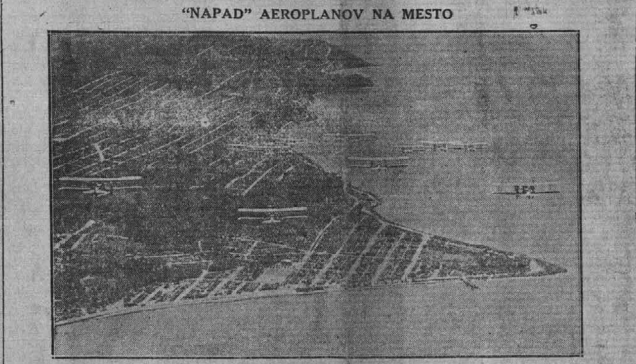
Pogled na mesto Seattle, Wash., nad katerim so se nedavno vršile zračne vojaške vaje. Okrog 60 aeroplanov je ob tej priliki obletavalo mesto in ga napadalo s slepimi bombami.