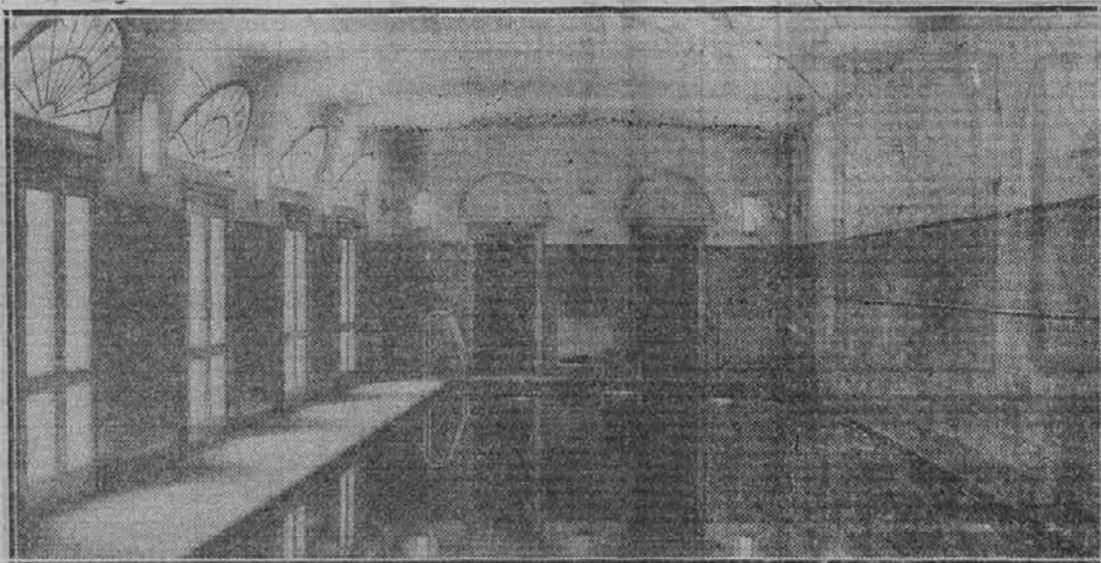
Edina sportna zabava, s katero se bavi predsednik Roosevelt z zanimanjem, je plavanje. Da mu bo mogoče uživati to zabavo vsak dan, se mu je v Beli hiši zgradilo kopalnico, ki ga kaže gornja slika. Stroški zanj so se pokrili z nabiranjem med predsednikovimi prijatelji.