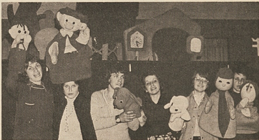
Lutkarji KDZ so po predstavah iskali tudi kontakt z majhno publiko in se predstavili začudenim otrokom v polni velikosti.

Toda glavni cilj te lutkovne igre ni bil, da bi otrokom posredovala ure smehe, marveč da bi jim učila ter jim pokazala, da se jim nikakor ni treba sramovati slovenščine, svoje materinščine. Sedaj, ob koncu tridesetih predstav, se da reči, da je igralcem to v precejšnji meri tu-