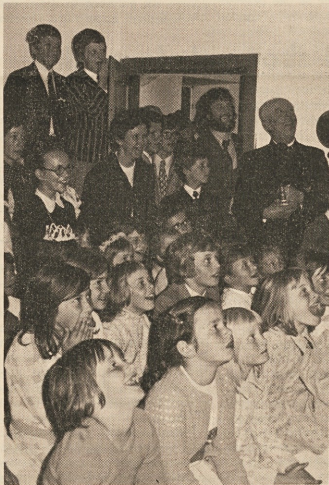
Levo: Z žarečimi obrazi so najmlajši s'edili poteku lutkovne veseloigre „Kozika Lizika“, tukaj v Bistrici na Zilji. Za album so se vsi lutkarji tudi pustili fotografirati s cerkvijo v Bistrici na Zilji v ozadju (desno).

Povsod pa so videli po predstavah žareče oči, do ušes nasmejene obraze in spoznali, kako hvaležni so jim bili ti otročki za igro. To je za igralke in igralce Koroške dijaške zveze bilo najlepše plačilo in obenem so trdno sklenili — ter to otrokom tudi obljubili — da bodo lutke kmalu spet prišle na koroške odre.