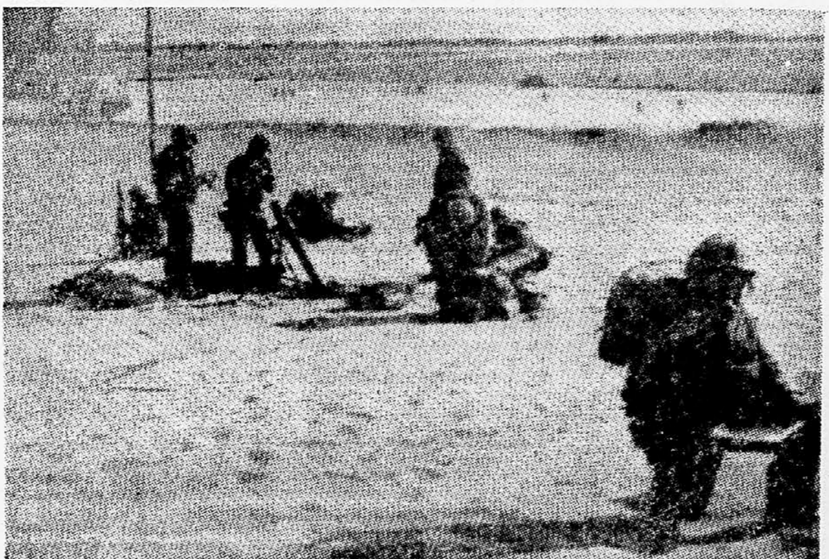
Ameriška pomorska pehota na obali pri Bejrutu po izkrcavanju na libanonska tla.

Včerajšnji razgovori med zunanjim ministrom Velike Britanije in ZDA Lloydom in Dulleom so trajali skoraj neprekinjeno 7 ur in pol, in so bili končani pozno ponoči. Britanski zunanji minister je po razgovorih izjavil, da so bili le-ti koristni.