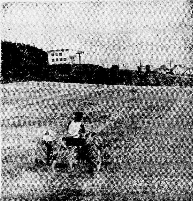
Na požetih strniščih so plugi zoražili nove brazde, za novo setev

Primer zatiranja koloradskega hrošča in ameriškega kaparja kaže, kako potrebna je pri tem enotna skupna akcija. Tisti lastniki zemljišč, ki se zavedajo