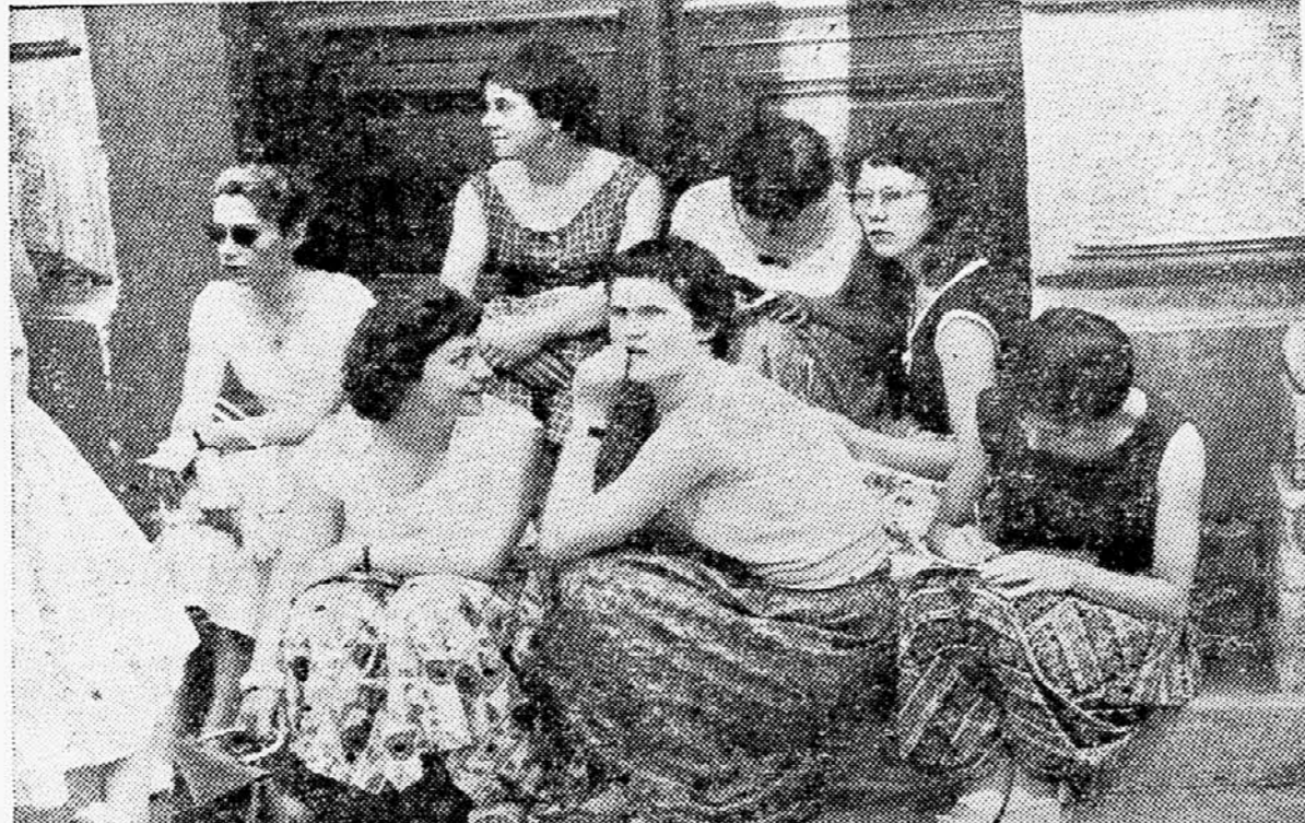
Kot šopek cvetle so se sedlele večeraj dopoldne mlade turistke iz Francije na stopnicah vhoda v pošto poslopje v Copovi ulici. Z razglednicami na koljenih in svinčnikom v roki so premišljevale, kaj naj pišejo domov — v Touraine de Blois na Lorri. Mislimo, da samo najlepše obkute in vrise iz naše Ljubljane. Zal objekti v »Leice« našega fotoreporterja ni zajel vsega šopka, temveč le manjši del, kljub temu pa je videti, da so mlade Francozinje, čeprav na stopnicah, počutje kot doma.

Občinski ljudski odbor je na podlagi ugotovitev finančne pomanjkljivosti pri preletu poslovanja obrtnega podjetja »Meso-izdelki« sklenil, da se uvede v podjetje »Meso« - izdelki prisilna uprava.