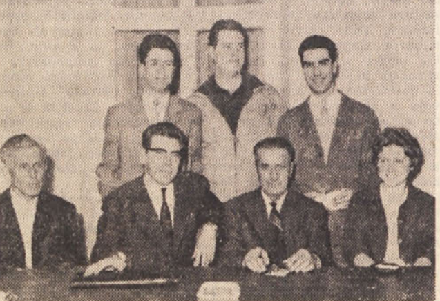
Novi odbor prosvetnega društva Škedenj