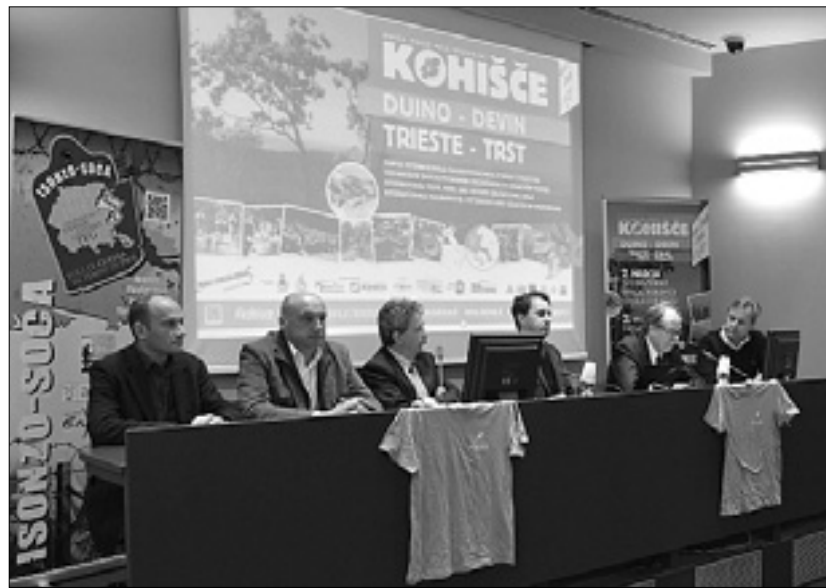
Z včerajšnje predstavitev pohoda v deželni dvorani Tessitori