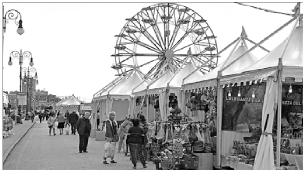
Sejem Expo Bavisela je odprl svoje utice in panoramsko kolo se je zavrtelo

Na nabrežju stojijo stojnice z različnimi izdelki, panoramsko kolo ponuja razgled na Tržaški zaliv