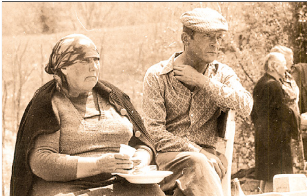
Levo, prizadeti potresenci iz Beneške Slovenije, spodaj montažne hiše, ki jih je prispevala in v občini Bardo zgradila Republika Slovenija