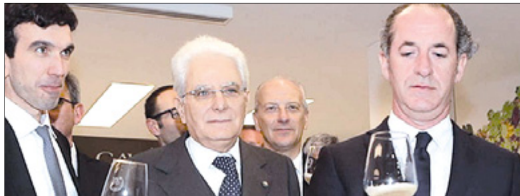
Minister Maurizio Martina, predsednik Sergio Mattarella in Luca Zaia nazdravljajo s proseccom na letošnjem Vinitaly

Nekdanji kmetijski minister kritičen do aktualnega ministra Maurizia Martine