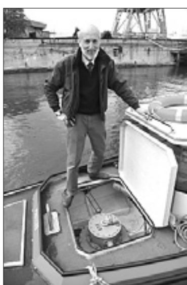
Inženir kaže Bivortix