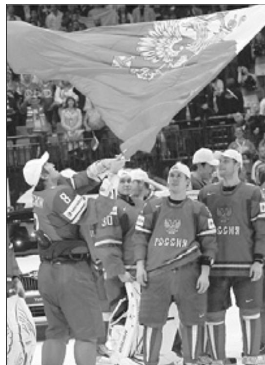
Rusi so zadnje zlato odličje osvojili na SP 2014 v Minsku

Letošnje prvenstvo se bo začelo danes, že prvi dan pa bosta na sporedu dva zanimiva obračuna: že popoldne v St. Peterburgu severnoameriški derbi med Kanado in ZDA, zvečer v Moskvi pa uvodna tekma za domače, tekme pa bodo Čehi. (sta)