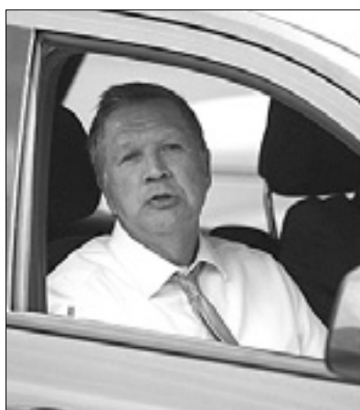
Tudi John Kasich se je umaknil

Kasicheva pozitivna kampanja se ni prijela, saj je republikanske volivce omrežil newyorški milijarder, ki po drugi strani ni varčeval z žaljivkami na račun političnih nasprotnikov niti zaveznikov. Redka izjema je bil Kasich, za katerega je Trump v sredo ocenil, da bi bil lahko dober podpredsedniški kandidat, saj bi mu zagotovil zmago v ključni državi Ohio. To je bila edina država, kjer je Kasichu uspelo zmagati. Do srede je zbral le 153 delegatov za konvencijo konec junija v Clevelandu, za zmago pa jih je potrebnih 1237. Trump jih je doslej zbral 1053 in ker več nima protikandidata, bo preostanek zbral v devetih državah, ki so še ostale do konca republikanskih strankarskih volitev.