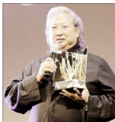
Sammo Hung z zlato murvo PJ

Nagrada Black Dragon, za katero so glasovali tisti udeleženci festivala, ki so imeli posebne akreditacije z rezerviranim sedežem v gledališču, je šla japonski drami Mohican Comes Home. Film se z lahkotno ironijo dotika težkih tematik bolezni in smrti v družini. Delegacija ustvarjalcev tega filma je stopila na oder in prejela še na-