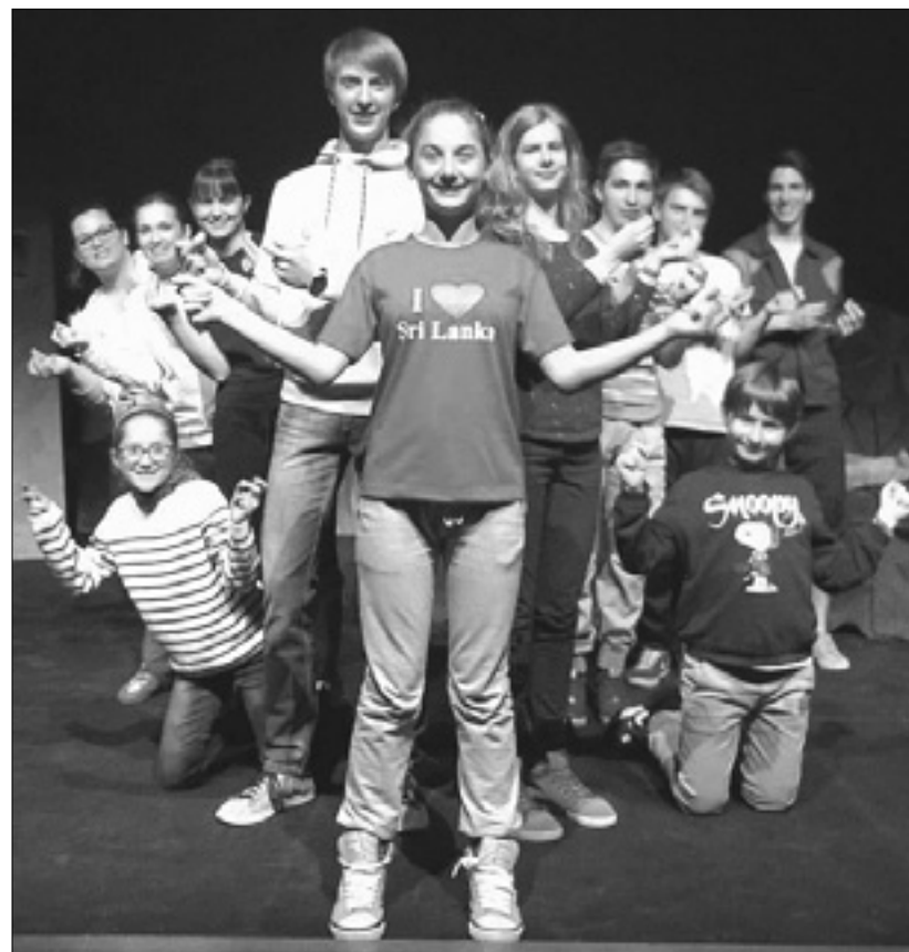
Gledališka skupina O'Klapa

V nedeljo, 8. maja, bo v centru Bratuž premiera igre Obuti Maček