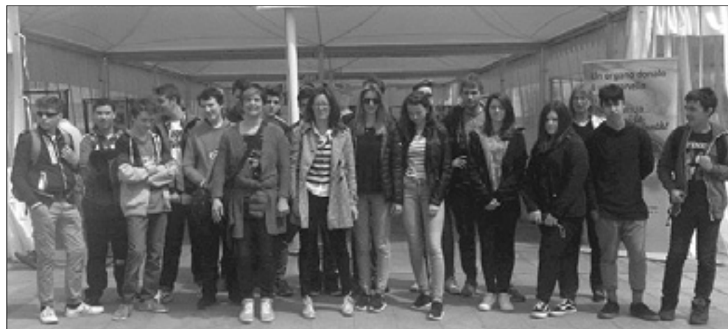
Dijaki tehničnega pola v Trzinu

Na tehničnem polu so se posvetili podnebnim spremembam in migracijam, licejci pa sadilni akciji