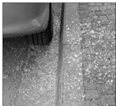
Sledi tatinskega pohoda BONAVENTURA

Po Trziču se spet potikajo tatovi, ki vlamljajo v avtomobile. V prejšnjih dneh so vlomili v tri vozila, ki so bila parkirana v Ulici Ponchielli. Steklo so razbili na avtomobilu znamke Bmw, na terenskem vozilu tipa SsangYong rexton in na tovornjaku. Lastnik tako rextona kot tovornjaka je domačin; ko se je včeraj zjutraj odpravil na delo, je našel na neprijetno presenečenje. Tatovi so iz rextona ukradli nekaj predmetov brez večje vrednosti, iz tovornjaka so pobrali zaboj z raznim orodjem, ki je vredno skoraj petsto evrov. K omenjeni škodi je treba pristi- šteti še denar, ki bo potreben za name- stitev novih šip. Konec marca so ta- tovi vlomili v avtomobil, ki je bil parkiran v Ulici Rosario. Iz njega so po- brali par čevljev, očala, nekaj oblačil in didaktične pripomočke, ki jih lastnica avtomobila - vzgojiteljica v jaslih - upo- rablja na svojem delu.