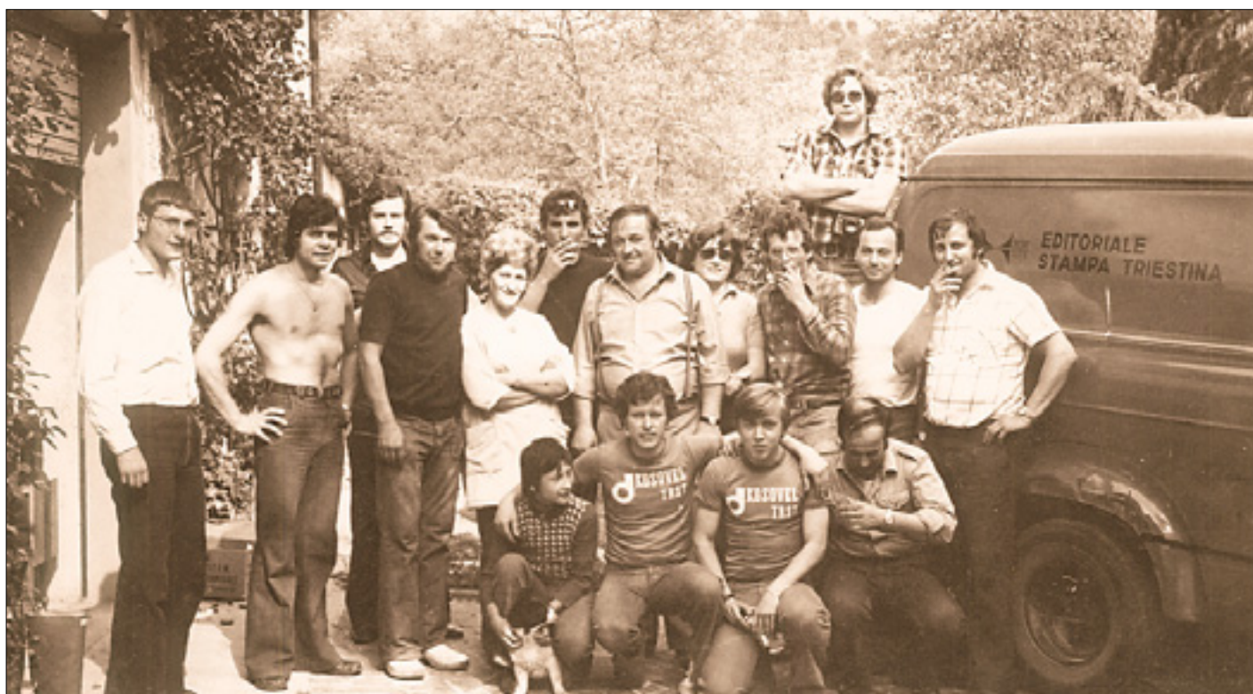
Nekateri udeleženci širokopotezne akcije pomoči iz Trsta in Gorice s kombijem ZTT