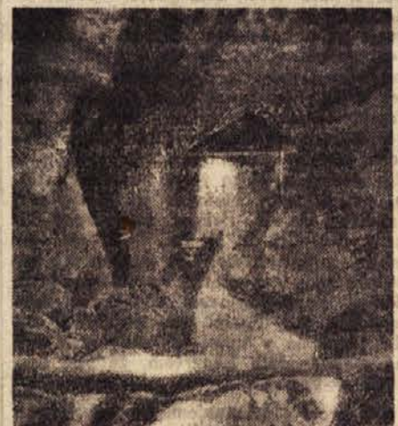
Cerkno pri Idriji — bolnišnica »Franja«, objekt elektrarne na dnu prepada nad hudournikom. Elektrarna je prilepljena na steno.