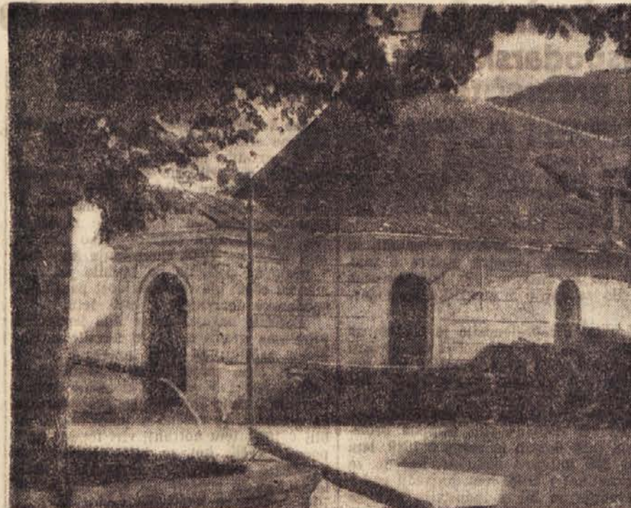
Idrija. Prvo delavsko gledališče pri nas iz prve polovice XVIII. stol. Danes je sicer stavba zapuščena, je pa dokument prvega delavskega gibanja pri nas in kot tak kulturni spomenik.

Poleg številnih reprodukcij spomenikov v posameznih spisih in poročilih prinaša vestnik ob koncu še v sliki naše spomenike in muzejske ustanove, slika kopije freske iz Turnišča v Prekmurju iz leta 1383, kopiral akad. slikar Jakob, na naslovi strani pa še bolj poudarja znanstveno važnost letošnjega kopiranja fresk