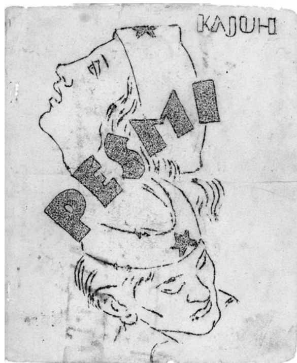
Naslovnica Kajuhovih Pesmi , nekje v gozdovih, 1943 (Muzej novejšje zgodovine Celje)

21. julija 1953 je bil Kajuh razglašen za narodnega heroja Jugoslavije. Njegova poezija še danes velja za enega najpomembnejših simbolov slovenskega partizanskega gibanja. Po njem se imenuje osnovna šola v Ljubljani in Kajuhova literarna nagrada ter več ulic in trgov po Sloveniji. V Celju se po njem imenuje cela mestna četrt. Kajuh velja skupaj z Matejem Borom in Edvardom Kocbekom za enega najpomembnejših pesnikov druge svetovne vojne v slovenskih deželah. Njegove pesmi so zaradi svoje neposrednosti, melodične intonacije in preprostosti