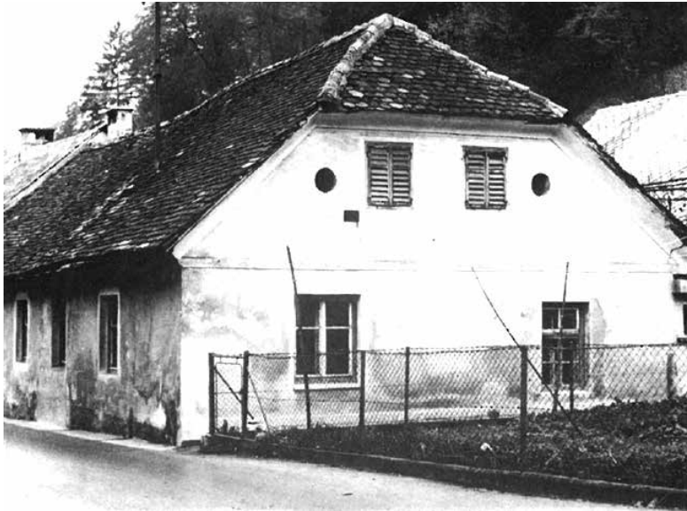
Rojstna hiša Franceta Balantiča v Novem trgu v Kamniku.