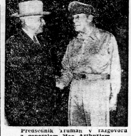
Predsednik Truman v razgovoru z generalom Mac Arthurjem

Washington, 12. aprila. Davi ob 1. (ob 7. po srednjeevropskem času) je objavila Bela hiša posebno uradno sporočilo, s katerim predsednik Truman odstavlja generala Mac Arthura z vseh poveljniških položajev na Daljnem vzhodu, to je s položaja vrhovnega poveljnika vojske OZN in ZDA v Koreji, vrhovnega poveljnika vojske ZDA na Daljnem vzhodu in vrhovnega poveljnika zavezniške vojske na Japonskem. Za naslednika generala Mac Arthura na vseh položajih je imenovan general Ridgway. Generala Mac Arthura so s kablagramom fakoj odstavili o odstavitvi in ga pozvali, naj takoj izroči vse posle generalu Ridgwayu.