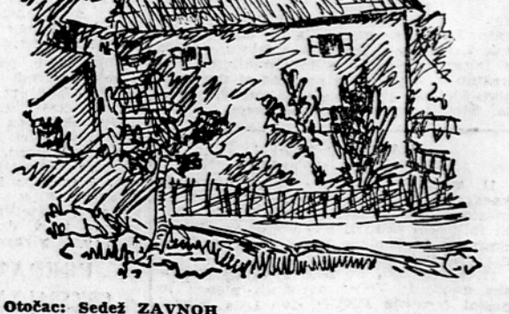
Otočac: Sedež ZAVNOH

Z boljših prihajajo razveseljive vesti. Nemška ofenziva na ruski fronti je v glavnem onemogla. Invazija na Sicilijo se razvija skoraj brez motenj. Naši so včeraj poročali o zavzetju Zvornika na Drini in rudnika Kladnja v osrednji Bosni.