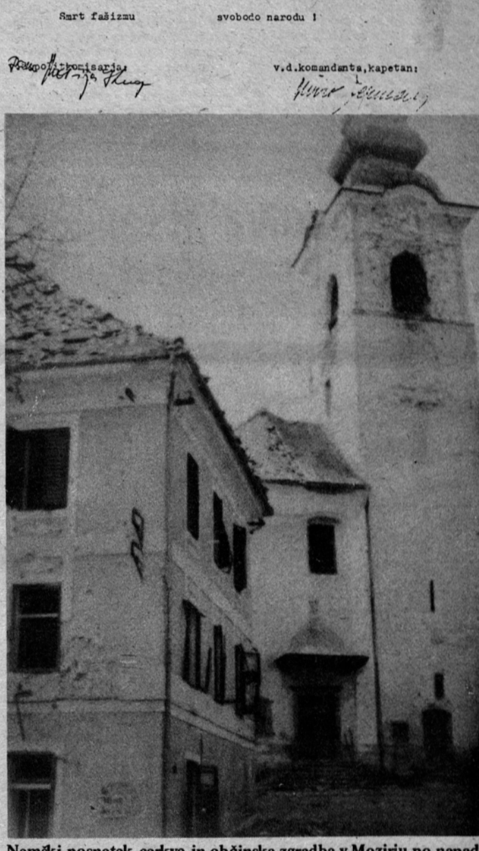
Nemški posnetek cerkve in občinska zgradba v Mozirju po napadu.