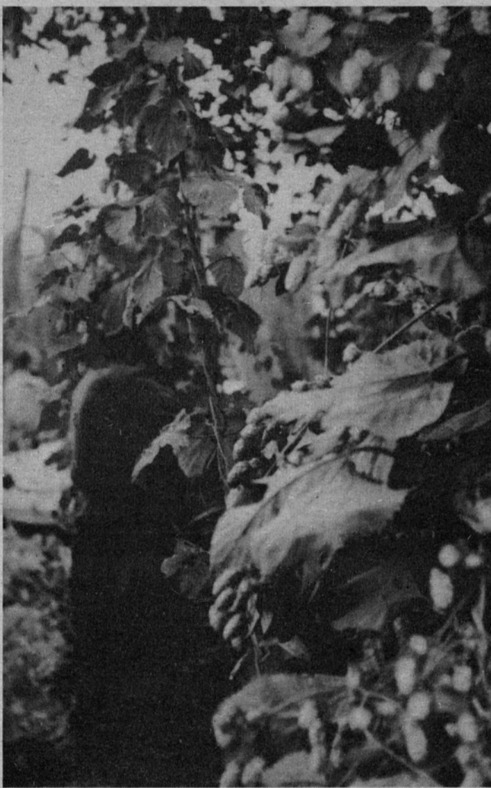
Zeleno zlato na Rečici

Stopnja pokritja uvoza z izvozom se je nekoliko izboljšala, saj je ob prvem trimesečju znašala 68,3%, ob polletju pa 114,0%. S tem se vedno ne dosežemo v resoluciji zastavljenih izvoznih ciljev. Še vedno nam hitreje narašča kliring, saj smo na to področje izvozili za 51% več kot v enakem obdobju lani, na konvertibilno področje smo izvozili za 15.458.000,00 din in nekaj malega še v dežele v razvoju.