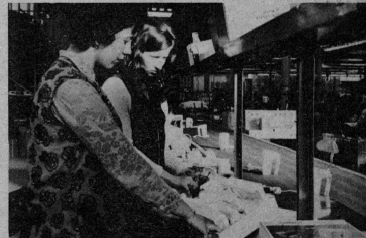
V MGA Nazarje

Do 1. 8. 1981 naj bi se torej zaključile naložbe v vrednosti 590.966.000,00 dinarjev, nadaljevale naj bi se v višini 200.343.716,00 din, ustavile pa bi se v vrednosti 36.523.000,00 dinarjev.