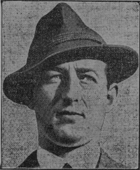
Avstrijski knez Starhemberg je izpadel kot podkancler iz dr. Schuschniggove no- ve vlade.

Iz rumenega napraviti belo — nobeno čar- dejstvo! Koliko gospodinj toži, da je njihovo pe- rilo, poprej tako lepo belo, že po nekoliko pra- njih porumenelo. Ker trud in muka, vse men- canje in drgnenje nič ne pomaga — perilo je in ostane rumeno. Pa vendar ni nobeno čarodej- stvo, dobiti zopet lepo belo perilo. Za pranje se mora vzeti samo zares dobro milo — Schichto- vo terpentinovo milo. To čisto jedrnato milo od- pravi brez truda in prizanesljivo vso nesnago iz perila. Schichtovo terpentinovo milo pere ble- ščeče belo.