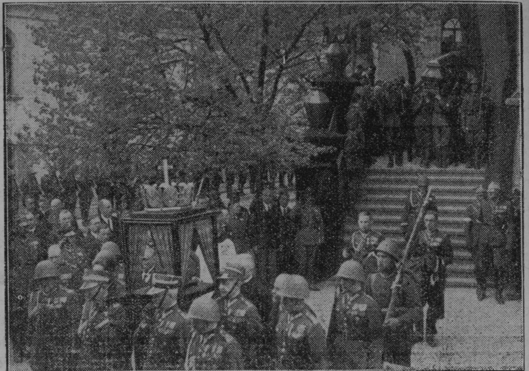
Na dan obletnice smrti poljskega maršala Pilsudskega so položili maršalovo srce k ostankom njegove matere v Vilni.