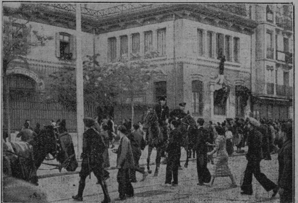
Španski komunisti napadajo samostan.