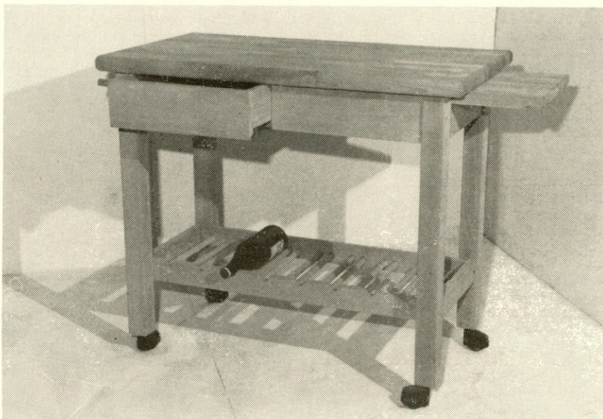
Novosti v proizvodnji miz