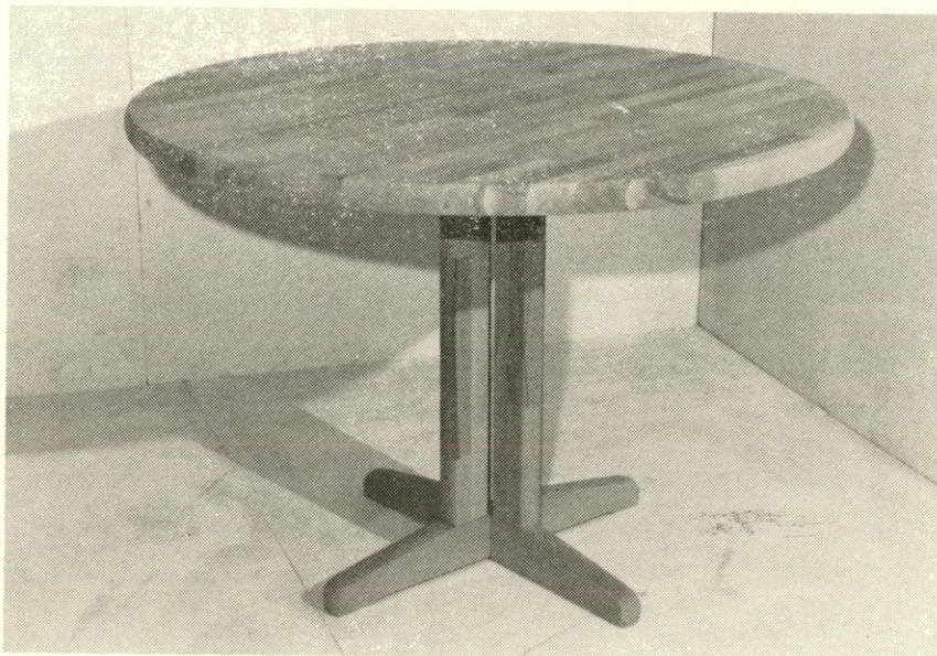
Še ena od novosti v proizvodnji miz

Dajmo, pokažimo malo več smisla za to področje in poskušajmo z večjo udeležbo nekako izraziti zahvalo prirediteljem in tudi nastopajočim. To pa je tudi ena izmed oblik medsebojnega spoznavanja in zblíževa-