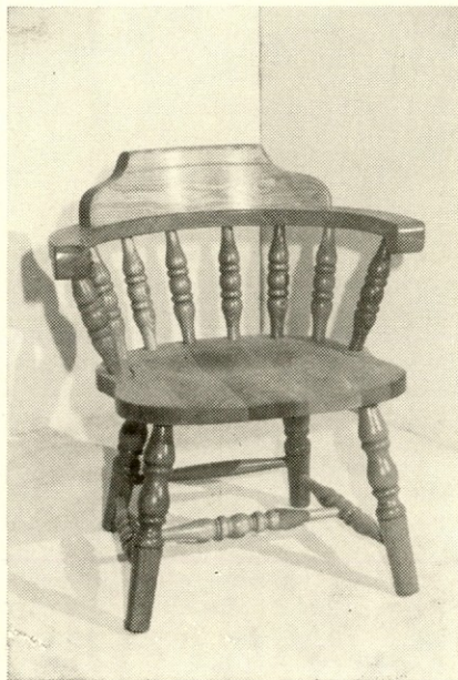
Nov tip stola št.

in podobnih materialov. Pri tem pohištvo je barva povsem prekrila teksturo lesa. Sijaj lakiranih površin je bil majhen (30° po Gardnerju). Moda se je počasi spreminjala in kupci so pričeli vse bolj ceniti pohištvo iz masivnega lesa, obarvanega z lužili. Ta niso zakrivala teksture lesa, temveč še poudarila bogato raznolikost lesa, ki daje prijeten občutek toplote in domačnosti. Izredno žive barve v vseh odtenkih so se počasi umaknile malo bolj