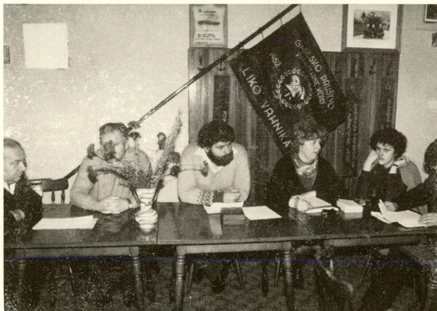
Na seji občnega zbora — delovno predsedstvo

Takoj v prvih mesecih novega leta sklicujemo občne zборе v industrijskih gasilskih društvih, prav tako tudi v prostovoljnih gasilskih društvih. Običajno pa imajo ljudje to kot neko formalnost, ki se zaključí s klobaso in kozarcem vina.