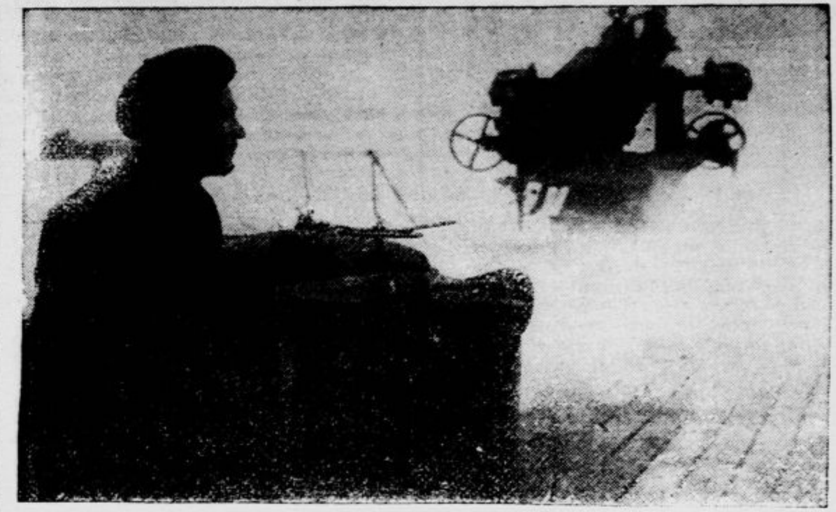
Italijanska podmornica se vraća s križarjenja po Atlantiku v svoje oporišće

— Učenišće. V ljubljansko bolnišnico so sprejeli zadnje dni več ponesrećencev. Z Dobrove so pripeljali z zlomljeno desnico