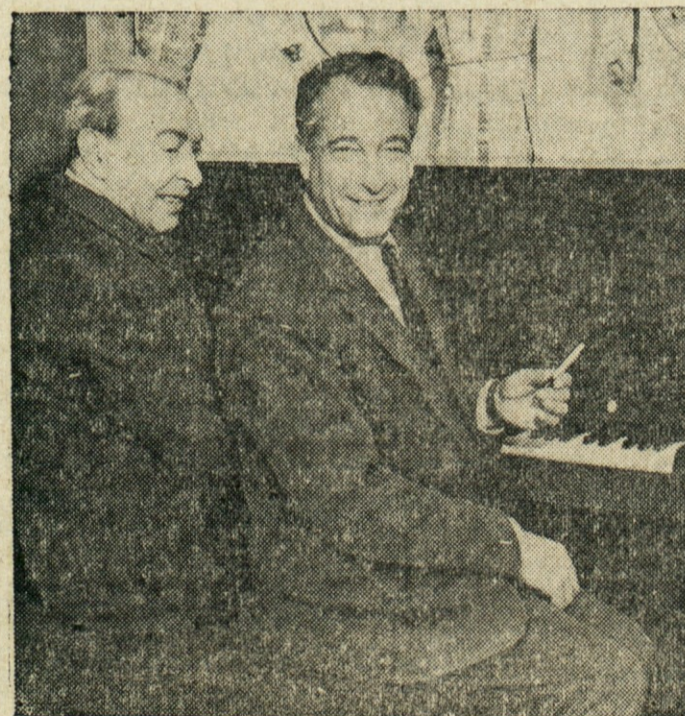
NA POTI — Znana pianista Benno Moiseiwitsch (na levi) in Victor Borge se nista mogla ločiti od piana niti na ladji, ki ju je vozila v London iz New Yorka.