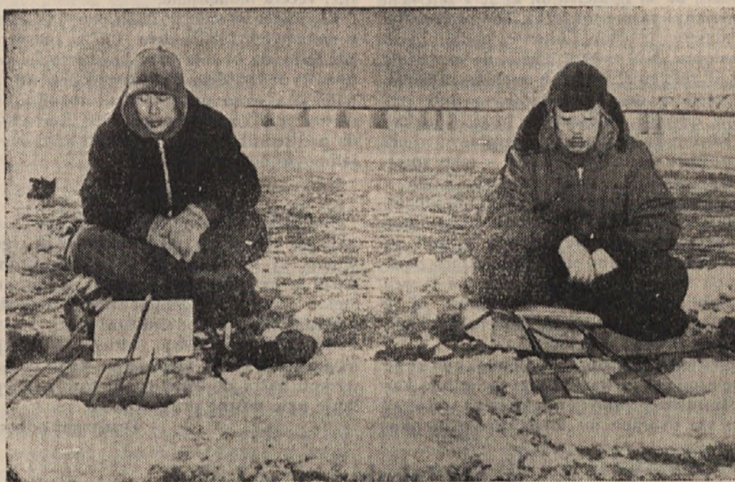
Na debele losose prezita ta dva korejska ribiča. Z aziatsko maršnostjo čakata na lovsko srečo. Proti mrazu sta dobro zavarovana. In čakanje se navadno izplača, ker z enim samim lososom zasluži ribič toliko kot delavec z dvodnevnim delom. (AND)

Če smo umetna gnojila kupili in ne raztrosili, poskrbimo, da bodo shranjena v suhem prostoru. Če je vlažno, se kaj hitro topijo kalijeva in soliturna gnojila in strdijo v kepe, ki jih težko spravimo iz vreče in zdrobimo v prah. Tudi apneni dušik se strdi in uniči vreče. Superfosfat se napne, da vreče popokajo. V vsakem slučaju, če je prodajalna blizu, je bolje kupiti samo toliko gnojil, kolikor jih bomo še isti dan ali v najkrajšem času raztrosili.