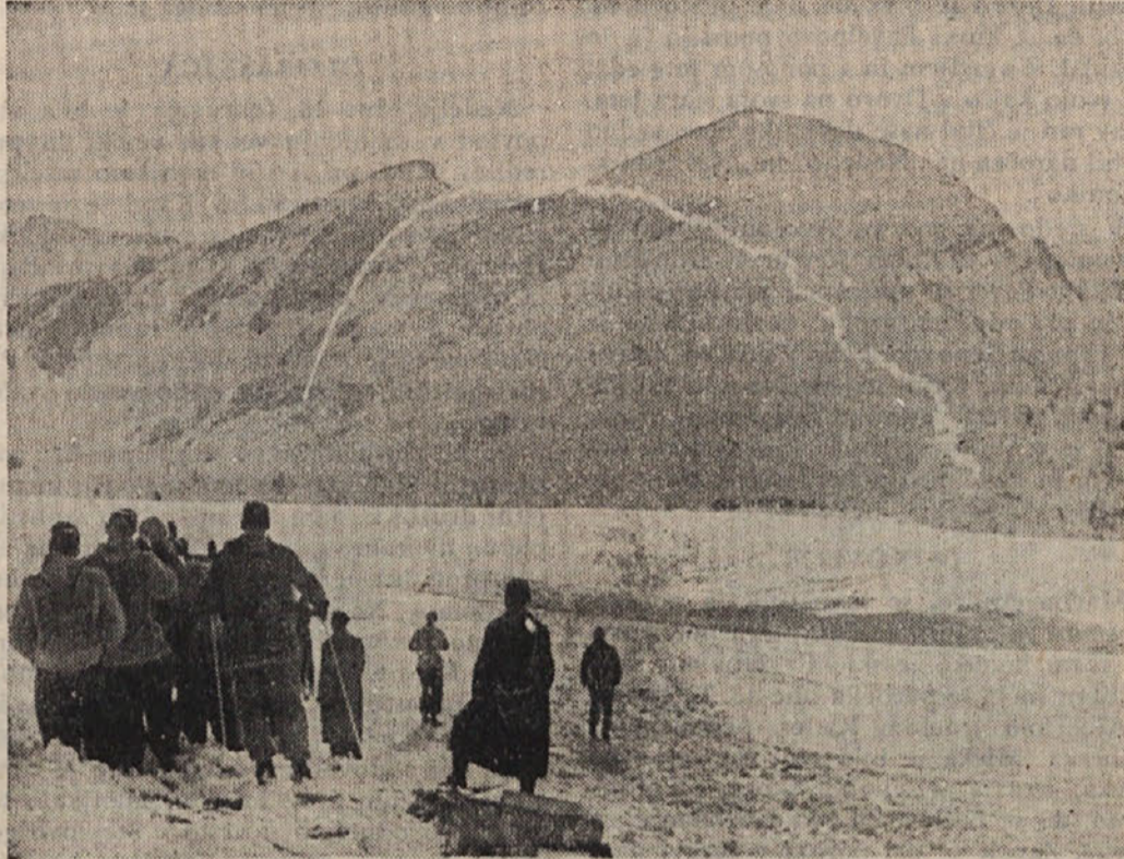
Na Nizkih Turah so delali poskuse z letali za reševanje ponesrečencev v gorah. Mesto za odskok iz letala so zaznamovali z raketo. (AND)

V zvezi s to izjavo enega izmed najvišjih vrhov naše prosvete bi se dalo mnogo kaj reči k vaši koroški zadevi, toda to prepustam vam.