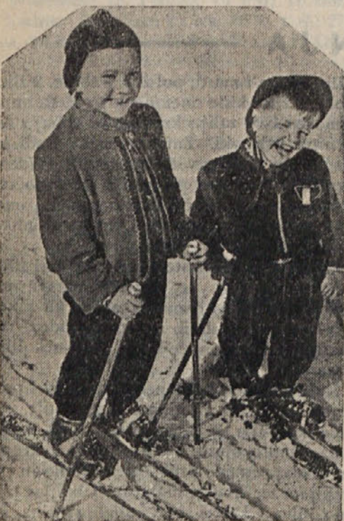
Ali naj pokažemo, kaj znamo?

Hočeš biti med odkritelji in izumitelji? Resno se loti učenja, bodi dober opazovalec in v svojem poklicu vesten in vztrajen delavec, ki stremi vedno za tem, kako bi se v svoji stroki izpopolnil in dosegel čim večji napredek. Samo tako boš lahko prekoračil vse poklicne težave, ki jih zahtevata danes življenje in napredni svet od mladega človeka.