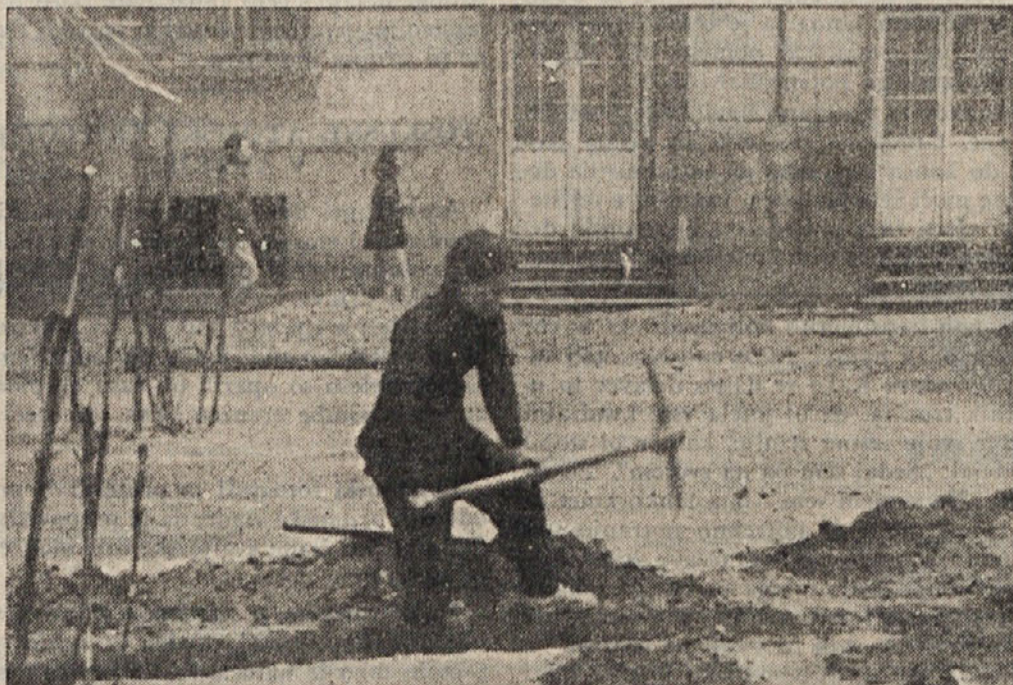
V Kantonu morajo opravljati ženske tudi težja dela pri gradnji cest. Kot vidimo na sliki, je komunistični režim na Kitajskem omogočil ženskam razne poklice, ki so drugje pridržani moškim. (AND)

(Podrobno poročilo prinesemo v prihodnji številki našega lista.)