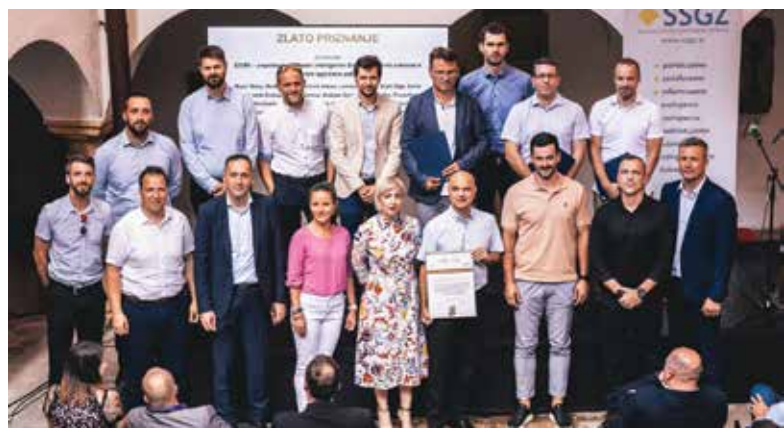
Podjetje BSH je prejelo zlato priznanje za popolnoma vgradni inteligentni Espresso kavni avtomat z znižanim ogljičnim odtisom EOX6.