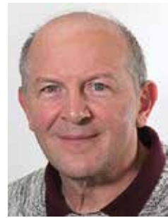
Piše Peter Weiss

Kontrasti v barvah. Na širokem dnu doline in na njenih robovih in obronkih vse zeleno v vseh mogočih niansah od temno zelenega borovja, smrekovja in jelovja do svetlo zelene, rumenkasto rjave travnikov, njiv, senožeti, pšeničnega, rženega in ovsenega polja blizu Logarja, Piskernika in Plesnika, glavnih treh kmetij v Logarski dolini. V najvišjih obrobni gorah, v vrtoglavih čerch in globinah, stenah in pečeh Ojstrice, Planjave, Brane, Rinke siva in bleđa barva prastarih očakov, ki s svojih strmin z nekim prikritim samozatajevanjem in hrepenenjem, vendar samodopadljivo gledajo na zeleno cvetočo pomlad svojih mladih let, ki počivajo doli v dolini. Pa tudi živi kontrasti v oblikah, črtah in potezah. Spodaj vse ravno, lahno valovito,