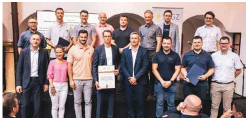
Še eno zlato priznanje je podjetje BSH prejelo za kuhinjskega robota K10 z ergonomičnim izmetom orodja in podaljšano življenjsko dobo motorja.