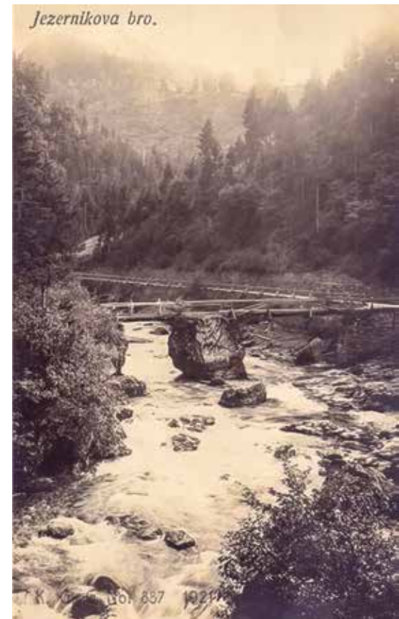
Jezernikova brv čez Savinjo pod Lučami po letu 1920 (po razglednici)

Ko hodiš ali se z avtom voziš od Logarja naprej mimo Planinskega doma v amfiteatralno zaokroženi konec doline, ki hrani pol ure nad sočnim zelenjem večni sneg in led, obrobjen s skalnimi