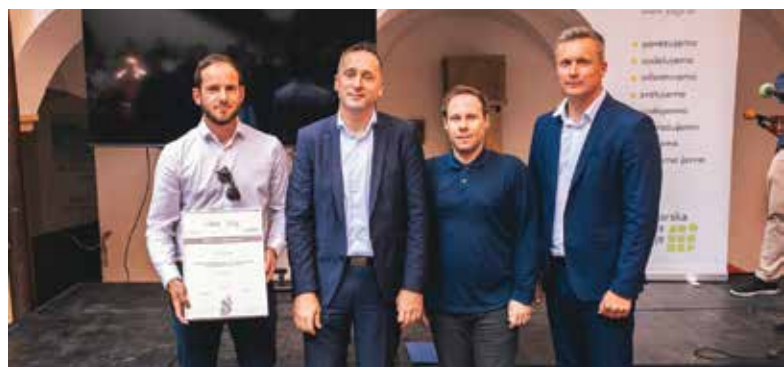
Podjetje Podkrižnik je prejelo srebrno priznanje za plovilo za trenerje jadranja.