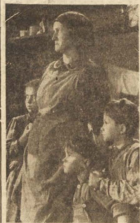
Ob vdoru Nemcev v hišo se otroci oklenejo matere

Nagel razvoj našega filma torej ni slučajnost. Skrbno vodstvo Partije ter njeno veliko delo v vzgajanju novega, socialističnega človeka, je zagotovilo tudi našemu filmu vse možnosti s tem, da lahko naši umetniški delavci ustvarjajo svobodna dela resnične, idejne vrednosti. V tem smislu lahko trdimo, da je tudi naš film bil ob svojem rojstvu postavljen na ono pravilno podlago, ki ga dviga nad filmom kapitalističnega sveta.