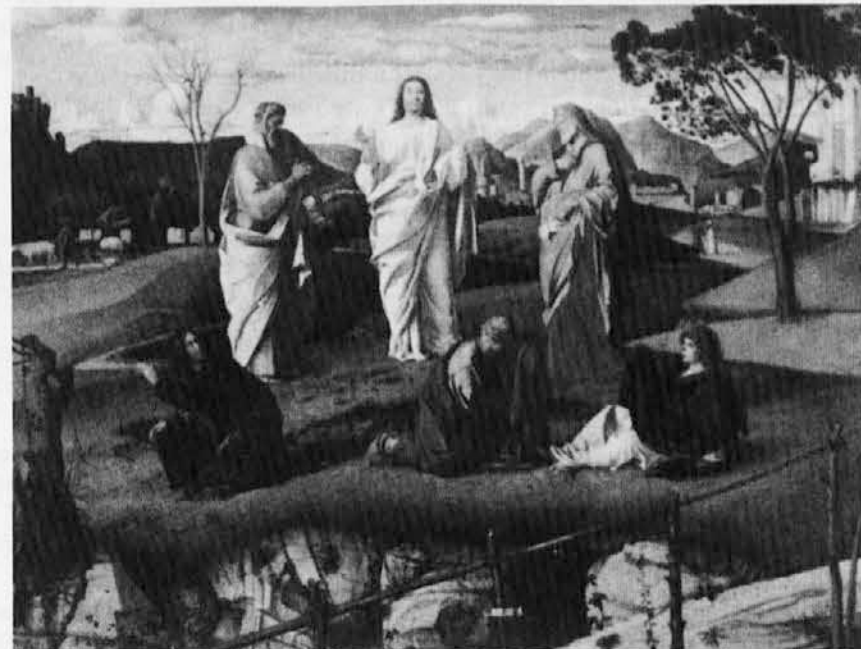
Dogodek Jezusove spremenitve na gori Tabor je skozi vso zgodovino umetnosti na poseben način navdihoval slikarje. Najprej so dogodek uprizarjali simbolično: Kristus pod podobo križa in ob njem apostoli, pod podobo jag-njet (prim. mozaik v absidi cerkve S. Apollinare v Ravenni). Šele poznejši umetniki so dogodek začeli upodabljati ikonografsko: Duccio di Buoninsegna, Giotto, Giovanni Bellini, Raffaello, Rubens in drugi. Na sliki: G. Bellini - Kristusova spremenitev (iz leta 1480).