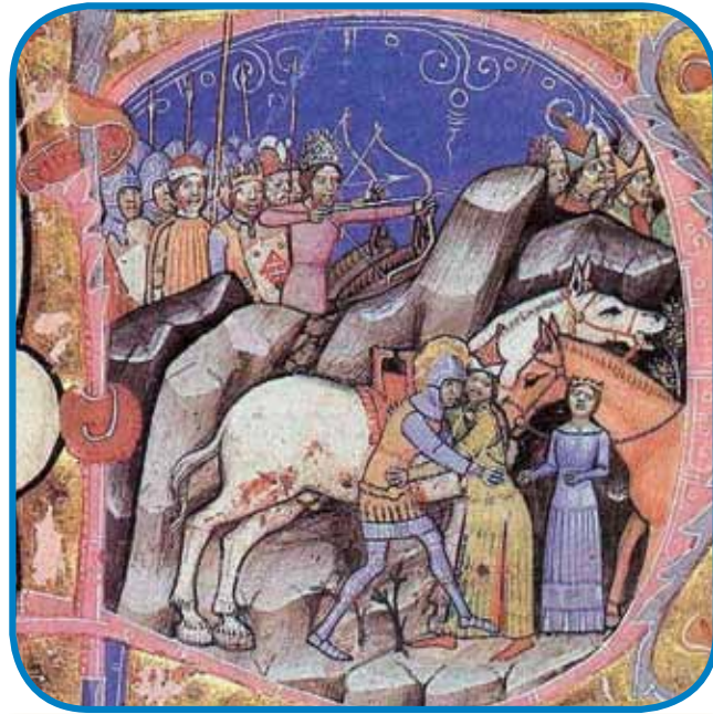
Na miniaturo v »Képes Króniki« se meče s kumanskim vitezom, ka aj bi rejšo lejpo dekle

V Vogrskom kraljestvi je grato znautrašnji mér, zatok se je leko Ladislav obrno na tihinsko, najbolje prauti djugi. V Zagradi je stvauro devéto vogrsko püšpekijo, štéra je