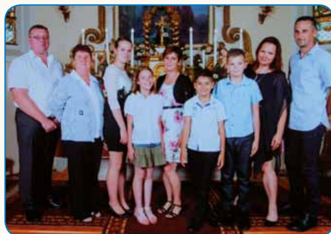
V MOSONMAGYARÓVÁRI SEM BILA »SODAK« stran 8