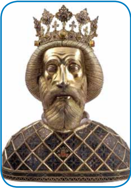
Takzvana »herma« z Ladislava glavauv, štéro držijo v baziliki v Györi

Andraš je s Polskoga domau pauzvo svojoga brata Bélo pa ga imenüvo za kneza (»ducatus« - herceg). Vküper sta