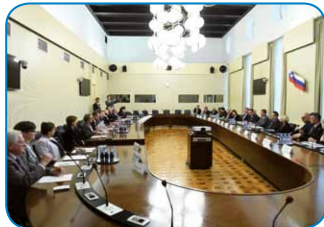
Seje Sveta Vlade RS za Slovence v zamejstvu so se udeležili predstavniki avtohtone slovenske narodne skupnosti v Avstriji, Italiji, Hrvaški in Madžarski