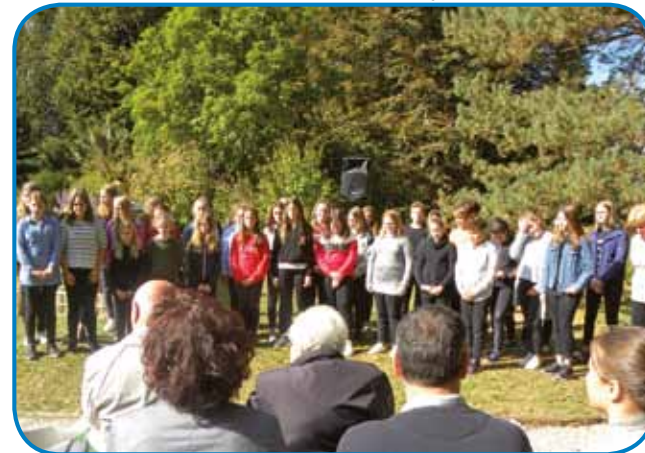
V kulturnem programu sta nastopila Mladinski pevski zbor Maurica iz OŠ Tišina in Dekliški sekstet Srednje zdravstvene šole iz Murske Sobotne