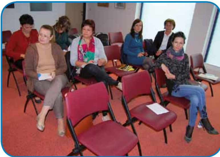
Del udeležencev na posvetovanju

omislili v Osrednji knjižnici Srečka Vilharja v Kopru, smo uvozili k nam. Prvo leto so sodelovale samo mestne šole, lani pa smo ga razširili še na okoliške šole na Krasu. Tek-