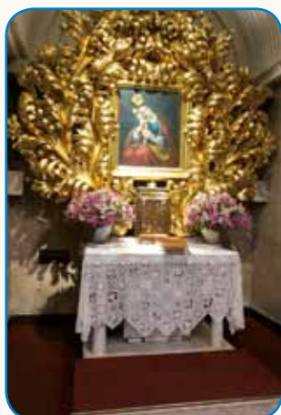
ROMANJE SAKALOVČANOV ... stran 5