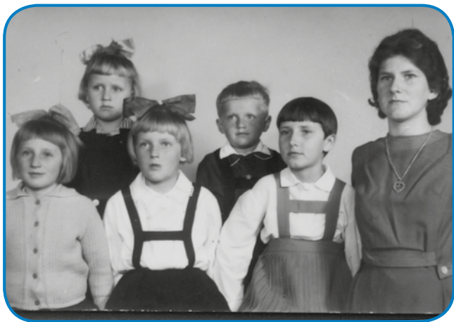
Na tom kejpji je šest mlajšov z materdjo; dva sta se kisnej narodila

so je nej pokopali. Tau je leta 1974 bilau, oča so 48 lejt stari bili, gda so tak naglo mrlji.«