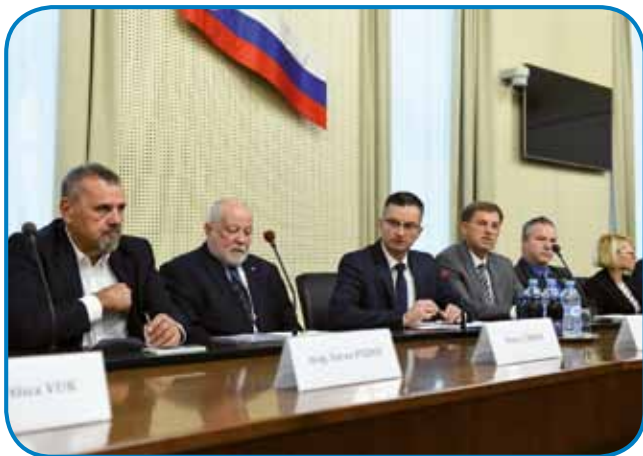
Predstavniki slovenske vlade, na sredini premier Marjan Šarec

nje teh oseb sistemsko uredi. Namreč prepričani so, da je ohranjanje jezika, kulture in identitete pogojeno s slovensko strokovno pomočjo, zato si prizadevajo za nadaljnje asistente v šolstvu.