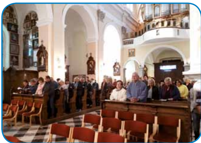
Pri sveti maši v baziliki

kalovcev, ko so se 5. oktobra 2019 v organizaciji slovenske narodnostne samouprave napotili na Brezje.