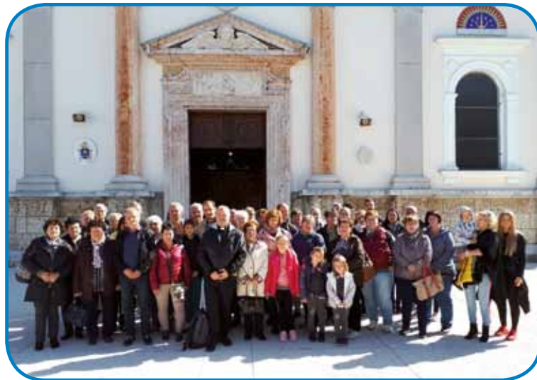
Sakalovski romarji pred baziliko Marije Pomagaj na Brezju