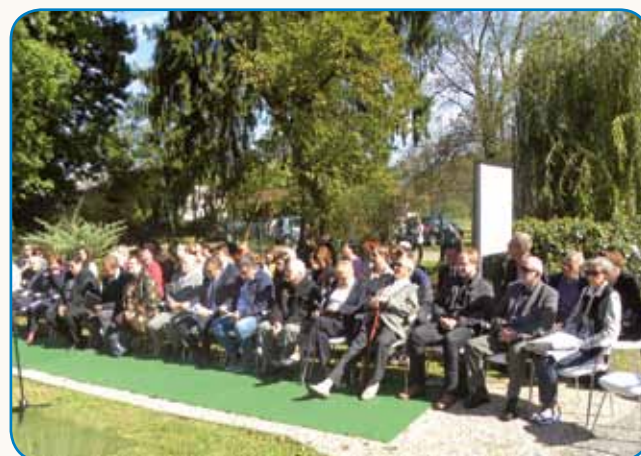
JAZ, MLADI PREKMUREC; JAZ MLADI PRLEK - DANES IN TUKAJ stran 9