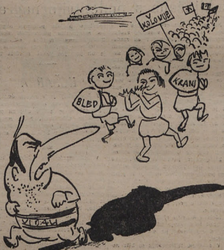
Tako gospod Vidali, mi gremo v Slovenijo na počitnice, ti pa lahko greš hladit svojo jezo v Mehiko...

Prve skupne tržaskih otrok so te dni odpotovale v počitniške kolonije v Slovenijo, čeprav si kominformisti pulijo lasce od jeze.