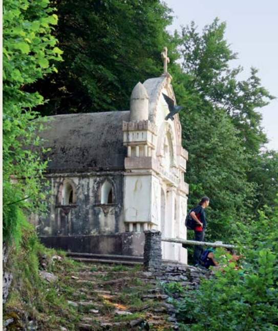
Italijanska vojaška kapela Bes