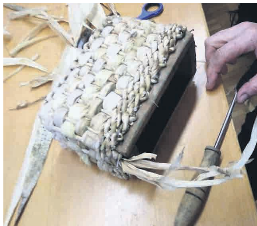
Še malo, pa bo košarica iz ličja dokončana.

pozornost pa namenili izobraževanju s prenosom rokodelskega znanja, zlasti preko delavnic. Del projekta je namreč tudi enajst rokodelskih delavnic, kjer bodo udeleženci ali pa so že, nekaj delavnic je že zaključenih, vezli in kvačkali, poleg klasičnega pletenja pa pletli tudi ličje, šibje in vence iz lüka, ustvarjali iz gline, izdelovali tradicionalni nakit iz papirja, rože iz krep papirja, spoznali pa še pridelavo in predelavo lanu. Poleg pridobivanja novih veščin se bo med njimi morda našel tudi kdo, ki jih bo videl kot priložnost za kreiranje lastnega delovnega mesta ali dodatnega zasluga za izboljšanje svojega ekonomsko-socialnega statusa.