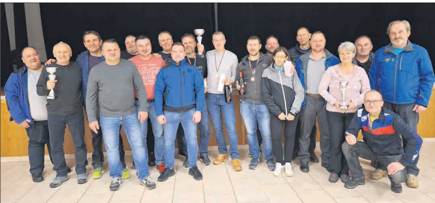
Skupinski sliko mladih (zgoraj) in članov