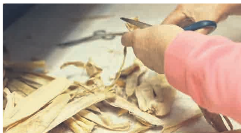
Ličje najprej narežemo na trakove.