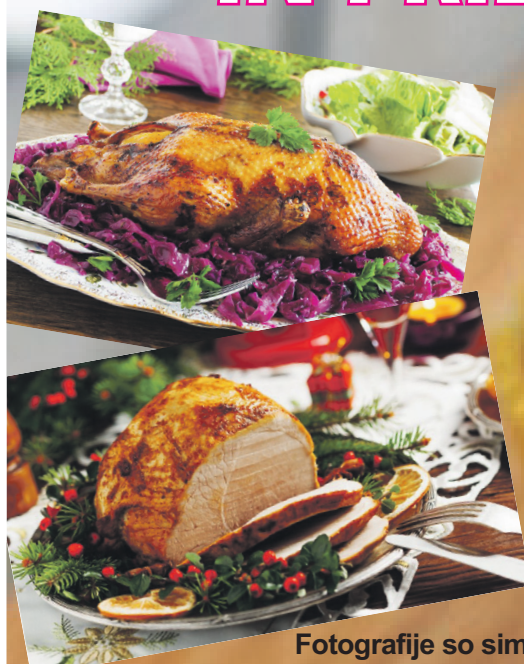
Fotografije so simbolične