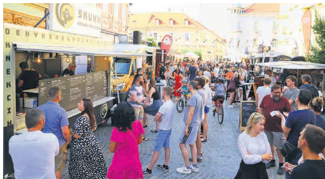
Z vidika prireditev in promocije je bilo lansko leto zelo uspešno, zabeležili pa so nekaj manj nočitev kot leta 2022.

Z vidika prireditev večjih odstopanj v lanskem letu ni bilo, zaradi vremena je odpadla le Ptujška noč. Skupno so naštel 120 večjih ali manjših dogodkov, na katerih so sodelovali. Veliko delajo tudi