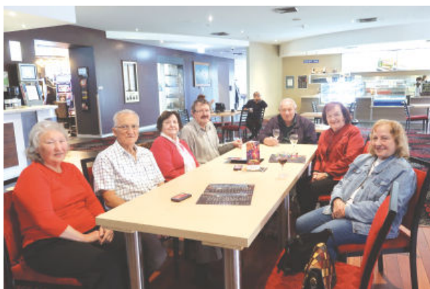
Prijatelji iz Slovenskega društva Sydney

Za očetovski dan je bila klubska dvorana prej vedno polna družin z otroki, letos pa nam ni bilo težko držati razdalje, ker je bilo prostora več kot dovolj.