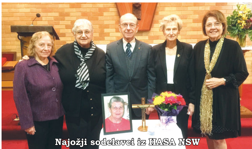
Najožji sodelavci iz HASA NSW

iskrena prijatelja nam vsem, v Newcastleu in Sydneyju. Številnim slovenskim rojakom sta nudila gostoljubje, pomagala potrebnim, bolnim in starejšim, jih vozila k zdravnikom, na obiske in drugam, tudi v Sydney ali v naš Merrylands na prireditve, srečanja rojakov, pihovanje, telovsko procesijo, igre, štefanovanje. Skupaj smo pripravljali svete maše za rojake v Newcastleu