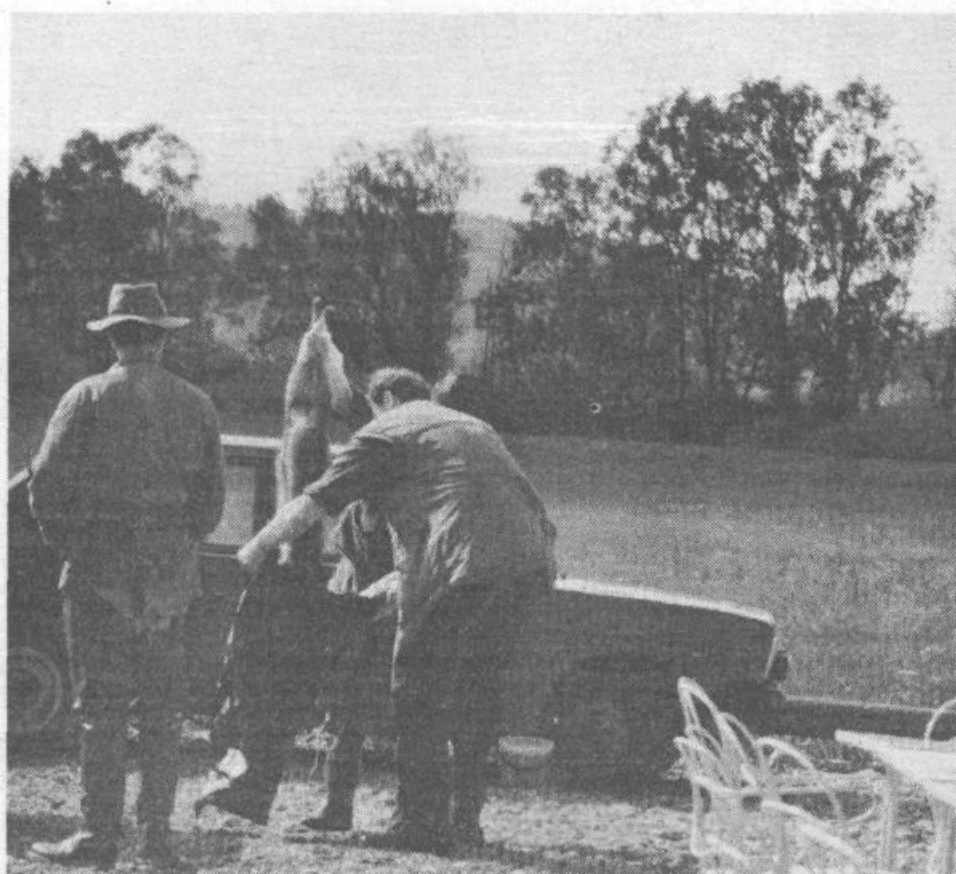
Lisica v vrečo! Taki so varnostni ukrepi, da se lovci zavarujejo pred okužbo s steklino na področjih, ki so okužena s to nevarno boleznijo.

Vsekakor je takšno gledanje ostalih občin do naše občine mestotvorno absolutno krivično, da, celo ponižujoče. Zato prosim organe naše občine za objektivno poročilo kako in kje ter kakšni bodo bodoči odnosi ostalih občin in mesta do naše občine.