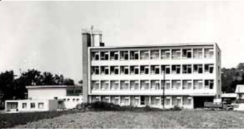
Fotografija iz šolske kronike (šolsko leto 1966/67)

Danes se piše leto 2017... Za Osnovno šolo Štore prav posebno, saj šolska stavba na Lipi praznuje častitljiv jubilej – petdesetletnico. 76 let po ustanovitvi prve osnovne šole v Štorah, ki je bila organizirana kot privatna nemška dvorazrednica s sedežem v spodnjih Štorah, so temeljni kamen za sodobno šolsko zgradbo položili leta 1965, otvoritev pa je datirana 5. septembra 1967. Nova zgradba z 20 učilnicami, dvema specialnima učilnicama, kuhinjo, jedilnico in upravnimi prostori je nudila dobre in zadostne pogoje za potrebe celodnevne osnovne šole vse do leta 1999, ko je bil končan prizidek. Stavba je vse odtlej ostala nespremenjena, pouk v njej pa z uvedbo devetletke drugačen.