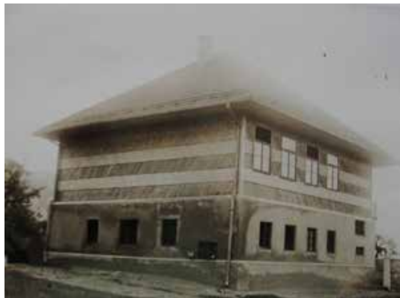
Novo šolsko poslopje na Svetini leta 1936