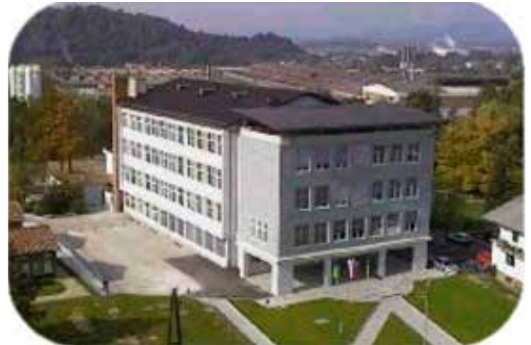
Šolska stavba danes

Kot se za obletnico spodobi, bomo v začetku prihodnjega šolskega leta, torej v septembru in oktobru 2017, praznovanje obeležili z različnimi aktivnostmi, dejavnostmi in prire-