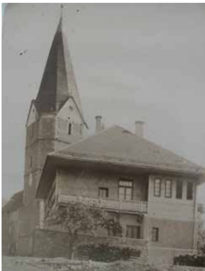
Pogled na svetinsko šolo in cerkev leta 1936