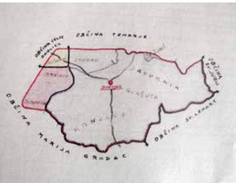
Šolski okoliš Svetina