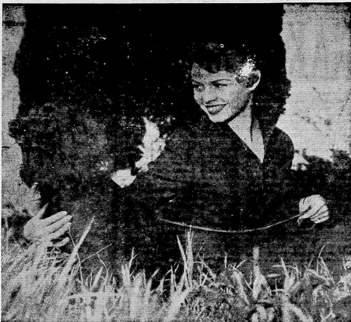
Vedno nasmejana in vedno prikupna je ena od najbolj popularnih francoskih filmskih igralk Brigitte Bardot

Ko sem se te dni sam aktivno udeležil televizijske oddaje našega programa, sem imel, če odkrito povem, tu in tam občutek, da ne gre povsem zares. In še zdaj moram reči, da se mi televizija na sploh ne zdi čisto zares. Kar se pa tiče strokovne plati, sem na lastne oči videl, kako je ta stvar zapletena in kako silno draga. Če človek pomisli, da celo velike postaje dajejo dnevno samo po eno uro ali pol ure programa, potem bi