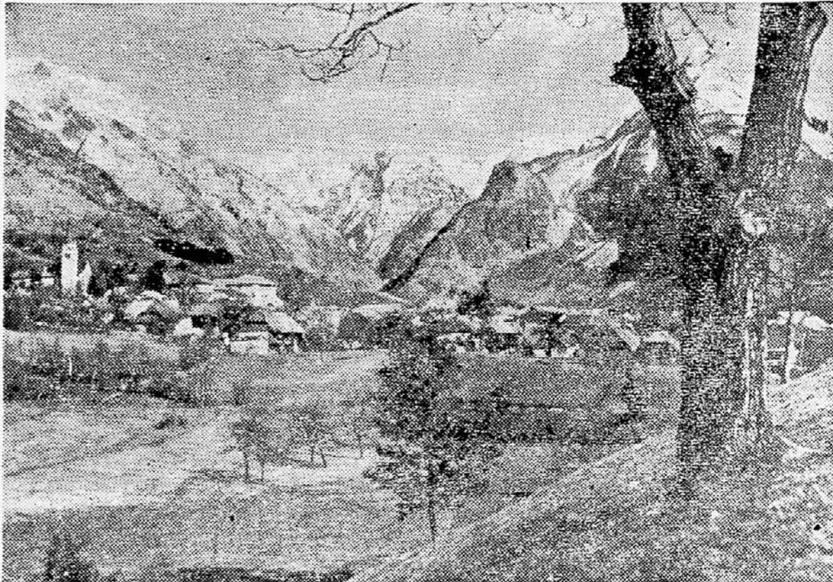
Na današnjem občnem zboru Turistične zveze Slovenije sta bili javno pohvaljeni občini Bovec in Log pod Mangartom zaradi vzorne čistoče in urejevanja svojih krajev. Na sliki: Bovec je res lep.

Volilni boj se je začel Varšava, 15. dec. (Tanjug). Na Poljskem se je začela živahna politična kampanja pred volitvami v nove ljudske odbore, ki bodo 2. februarja 1958. Danes je centralna koordinacijska komisija političnih strank objavila razglas, da bodo poljska združena delavska partija, združena ljudska stranka in demokratiška stranka na volitvah nastopile na skupni listi fronte narodne enotnosti.