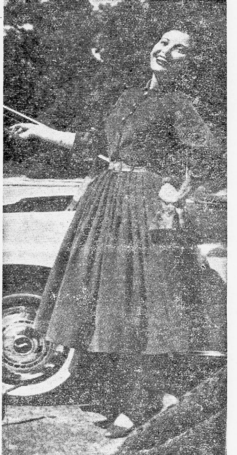
Lepa obleka iz temnozelenega žameta, ki je precej zaprta, krilo pa je močno nagubano.

Pomenku s starši je v tej šte- vilki »Mladega sveta« odmerjen precejšen prostor in prav je tako, saj morda ravno ti po- menki pomagajo marsikomu re- ševati razna vprašanja, ki jim sam ne ve odgovora.