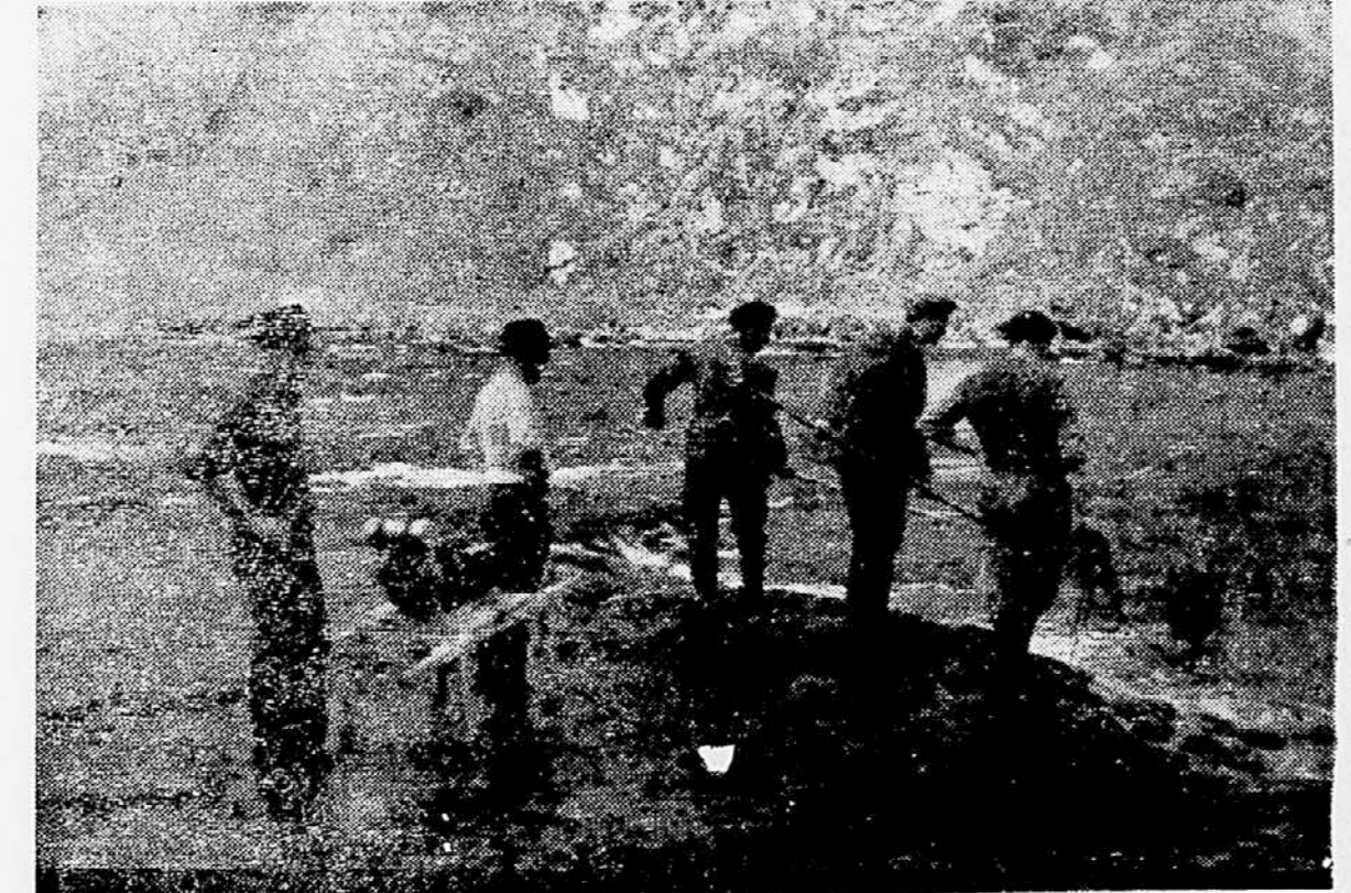
Elektroribolov na Krki pri Žužemberku

V Radošci so v nekaj urah nalovili blizu 200 postvri in nad sto kg klenov. Vse to so naglo prenašali v vališčne bazine. Belice pridejo na trg, postvri pa vrnejo po strokovnem osmukanju nazaj v potok. Prednost odlova plemenskih rib z elektroagregatom je očitna: Električna ribam ne škodi, na ta način ujete ribe pa pridejo brez vsake poškodbe v vališče in se vrnejo nepoškodovane v potok. Odlov plemenskih postvri morajo ribogojci opraviti v začetku drsti, ki pada v zimski čas. Delo v mrzli vodi je izredno naporno in ogroža zdravje. Kljub temu so se ga naši ribiči in ribogojci oprizeli z zglednim elanom in ga opravljajo z ljubeznijo do stvari in vedrem razpoloženju. A. S. Pirc