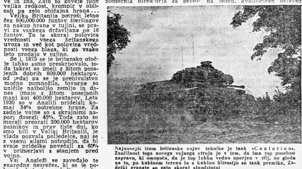
Najnoviši izum britanske vojne tehnike je tank »Centurion«. Značilnost tega novega vojnega stroja je v tem, da ima top posebno napravo, ki omogoča, da je top lahko vedno uperjen v cilj, ne glede na to, po kakšnem terenu in s kakšno hitrostjo se tank premika. Zadetki granate so zato skoraj stoodstotni