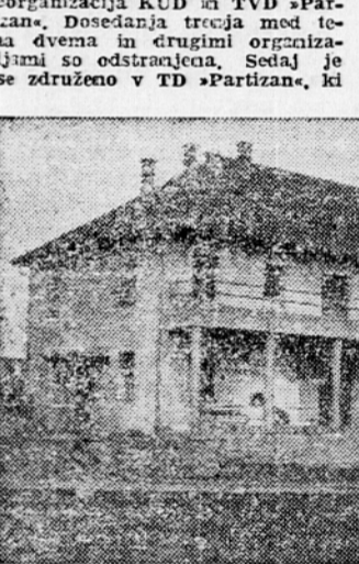
Dom »Partizana« v Ormožu

Letos je bila v Ormožu izvršena reorganizacija KUD in TVD »Partizana«. Posedanja tretja med tema dvema in drugimi organizacijama so odstranjena. Sedaj je vse združeno v TD »Partizana, ki