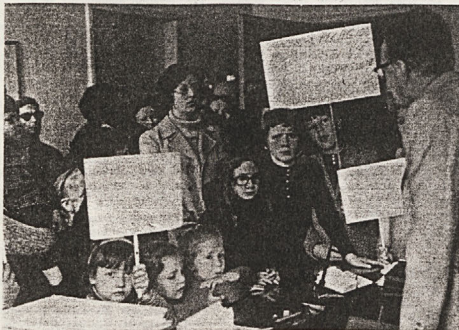
Položaj mestne prevozne službe je vse prej kot urejen. Isto velja tudi za okolico, kar je potrdila tudi stavka delavcev, ki je bila ta teden. Pred kratkim je na tržaški občini protestirala delegacija iz okolice Sv. Ivana. Starši so pripeljali s seboj svoje otroke, ki obiskujejo šolo in so prizadeti zaradi neurejenega prometa.

Na posvetu so govorili tudi o atomskih minah na Krasu ter poudarili, da le-te predstavljajo hudo oviro pri razvoju dežele in trajno nevarnost, hkrati pa preprečujejo, da bi dežela vršila poslanstvo, ki ga ima na mednarodnem področju in da bi torej v resnici postala «most za sodelovanje» s srednjeevropskimi deželami in s socialističnim Vzhodom. Podčrtana je bila tudi potreba po sklicanju konference o vojaških služnostih, na kateri naj bi sodelovale vse prizadete italijanske dežele. Prav tako je bilo podčrtano, naj dežela Furlanija-Juljska krajina vpliva na rimsko vlado, da bo sledila politiki pomiritve, miru, evropskega sodelovanja, kar naj privede do odprave nasprotujočih si vojaških blokov ter ustvaritve demilitariziranega pasu ob mejah med socialističnim in kapitalističnim svetom.